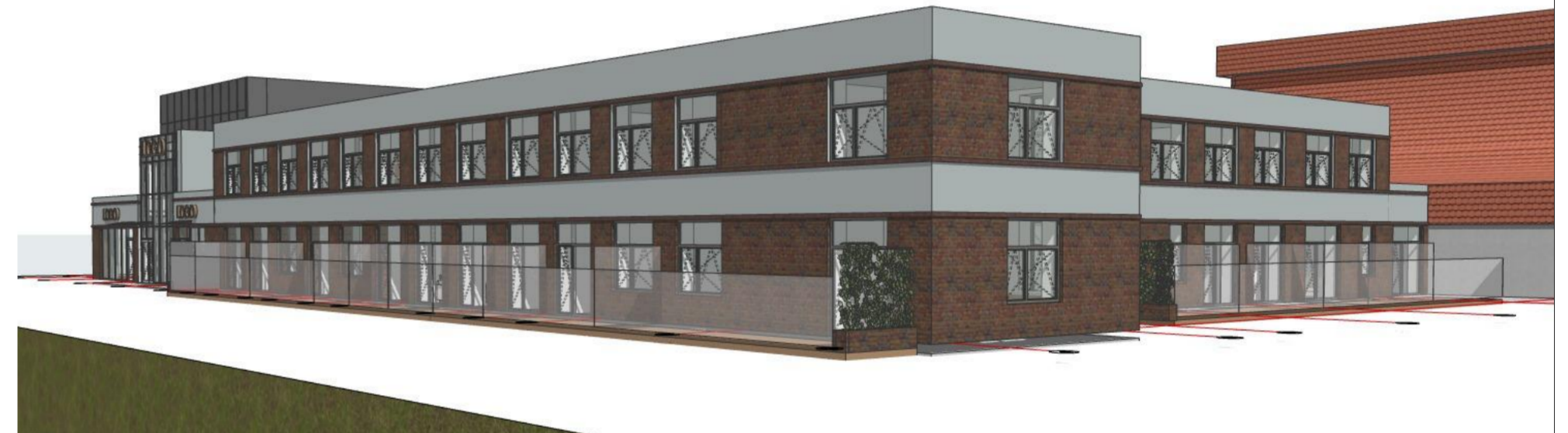
1:200,39 Generic Perspective 2