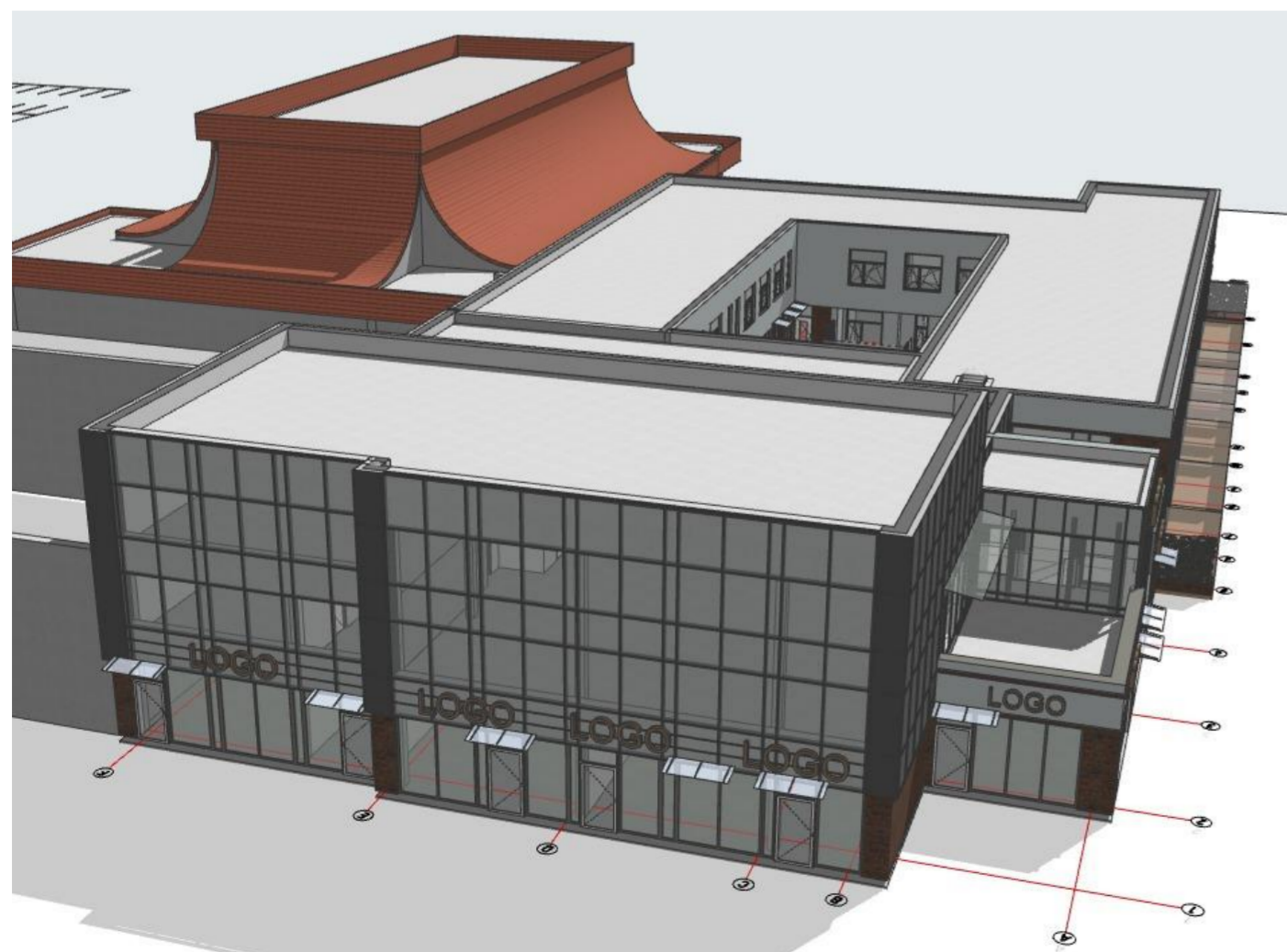
1:182,01 Generic Perspective 3