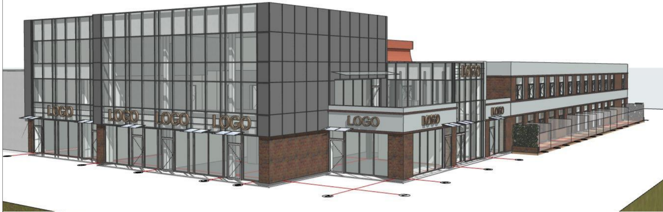
1:165,01 Generic Perspective 1