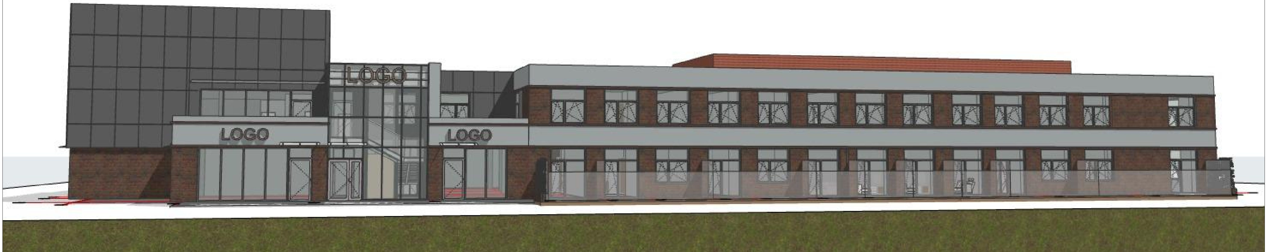
1:93,68 Generic Perspective 5