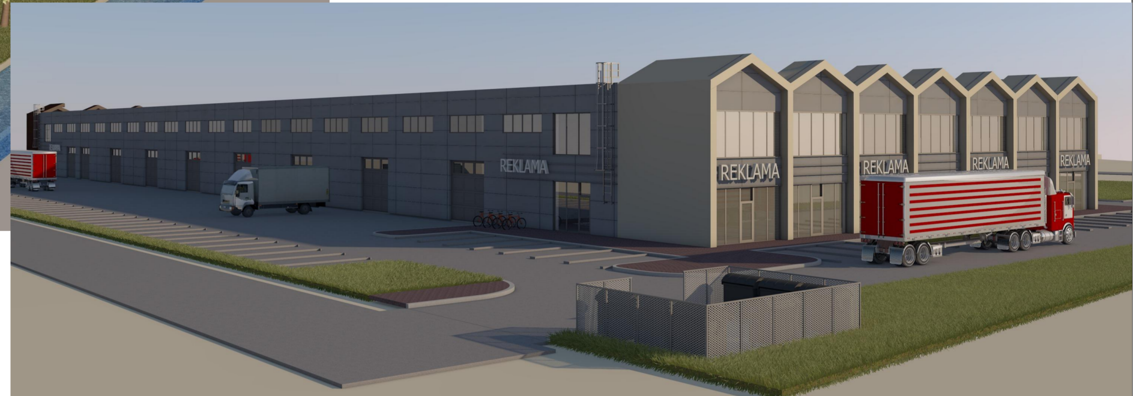
1:3,49 2024-04-18 Tilzes93 - Picture3