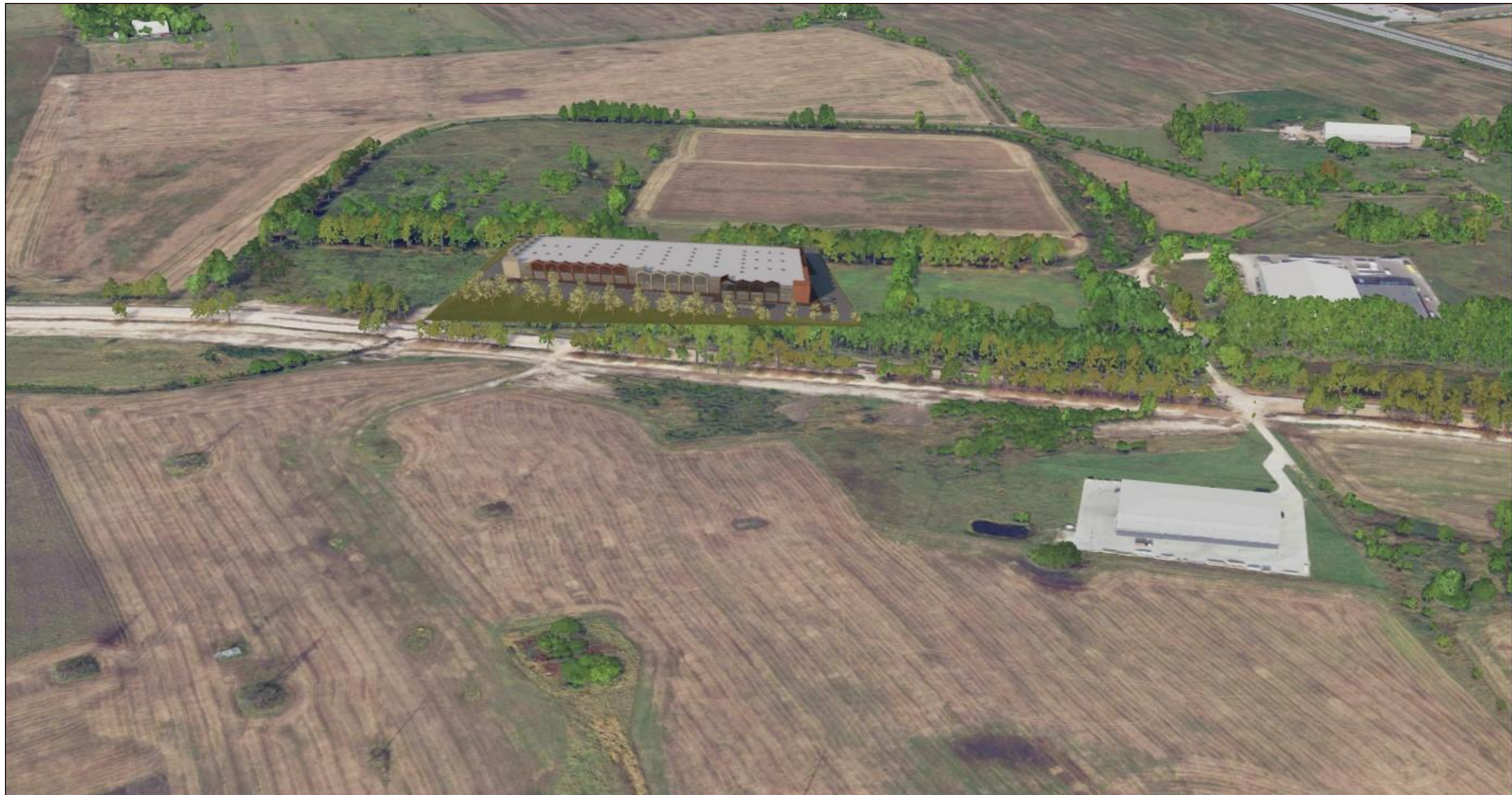
1:0,91 Panorama 11