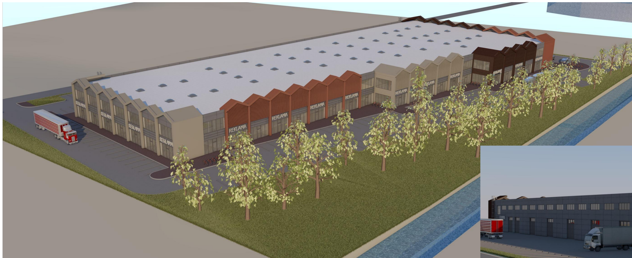
1:2,85 2024-04-18 Tilzes93 - Picture4