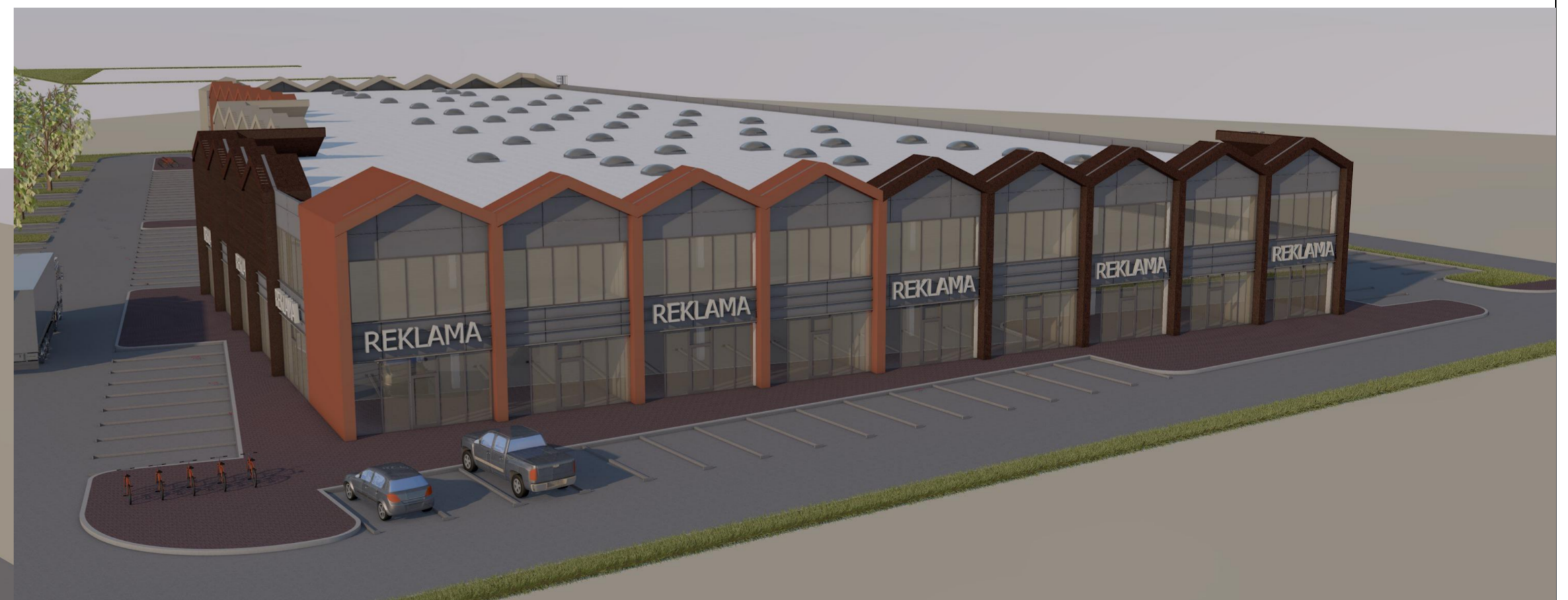
1:3,49 2024-04-18 Tilzes93 - Picture5