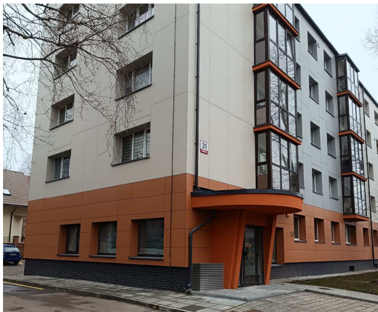
PIETINĖS PUSĖS FASADAS SU NUMATOMU KOND. BLOKU