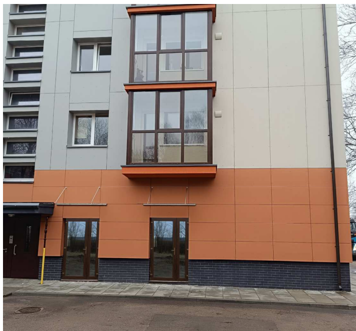
ŠIAURINĖS PUSĖS FASADAS SU NUMATOMOMIS PAKEISTI DURIMIS