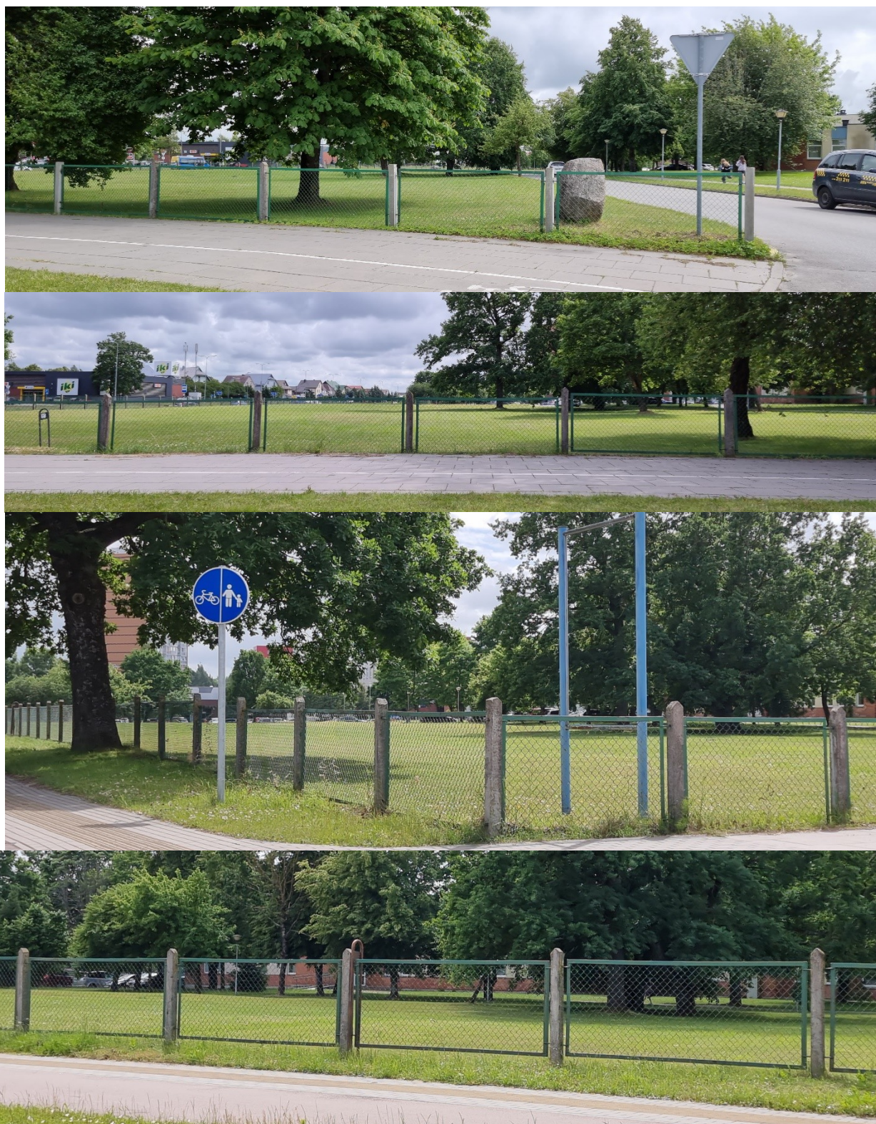
1 pav. Tvoros (Un. Nr. 4400-4830-1246) esančios Liepojos g. 39, Klaipėdoje, fotofiksacijos