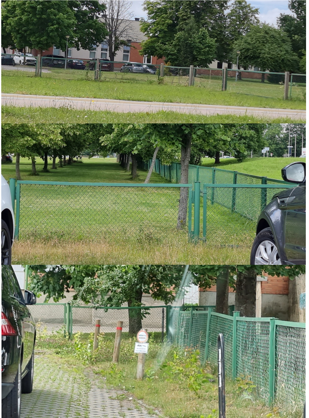
2 pav. Tvoros (Un. Nr. 4400-4830-1246) esančios Liepojos g. 39, Klaipėdoje, fotofiksacijos