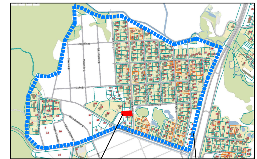
Planuojama teritorija Nagrinėjama teritorija