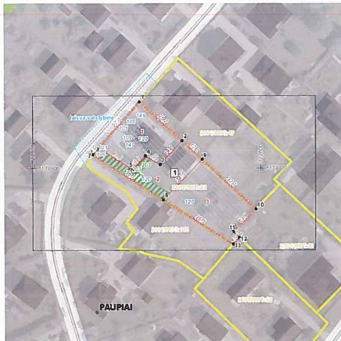
Situacijos schema, lapų išdėstymas