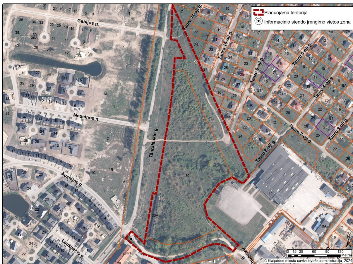
1 pav. „Informacinio stendo vieta“

18.1. detaliojo plano keitimo rengėjas, suderinęs su Klaipėdos miesto savivaldybės administracijos Urbanistikos ir architektūros skyriumi, privalo užtikrinti tinkamą teritorijų planavimo dokumento viešinimo, informacijos teikimo, susipažinimo su parengtu teritorijų planavimo dokumentu, pasiūlymų teikimo ir nagrinėjimo, viešo svarstymo procedūrų vykdymą taip, kaip tai numato teisės aktai;