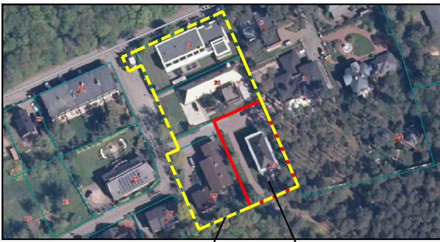
Koreguojamo DP riba