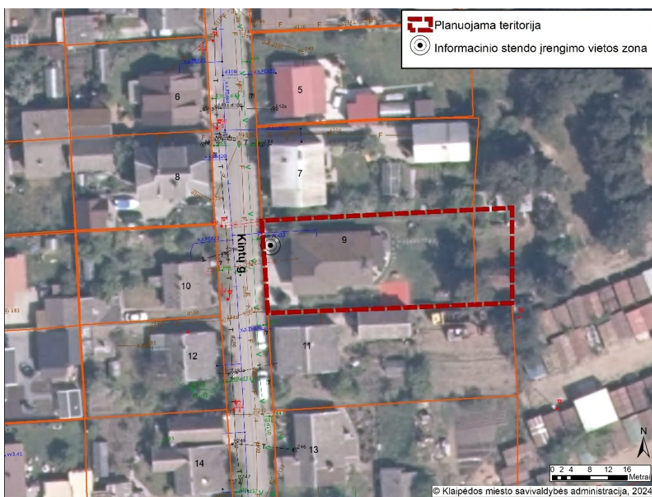
2 pav. Informacinio stendo vieta

19.2. detaliojo plano iniciatorius yra atsakingas už informacinio stendo įrengimą, priežiūrą viso detaliojo plano proceso metu. Taip pat turi užtikrinti informacinio stendo vizualinius, turinio ir konstrukcinius kokybės reikalavimus. Informacinis stendas turi būti pagamintas iš aplinkos poveikiui atsparių ir kokybiškų medžiagų. Informaciniame stende pateikiama informacija (tekstinė ir grafinė dalis) ne mažesniame kaip A2 formato lape (594 x 420 mm), kad tilptų visa Lietuvos Respublikos teritorijų planavimo įstatyme ir Visuomenės informavimo, konsultavimo ir dalyvavimo priimant sprendimus dėl teritorijų planavimo nuostatuose, patvirtintuose Lietuvos Respublikos Vyriausybės 1996 m. rugsėjo 18 d. nutarimu Nr. 1079, nurodyta skelbtina informacija. Informacija stende turi būti pateikta aiškiai, įskaitomai ir be gramatinių klaidų. Informacinis stendas turi būti įrengiamas 2 pav. „Informacinio stendo vieta“ nurodytoje zonoje, įvertinus konkrečios vietos inžinerinius tinklus, susisiekimo komunikacijas, reljefą, esamus želdinius ir statinius.