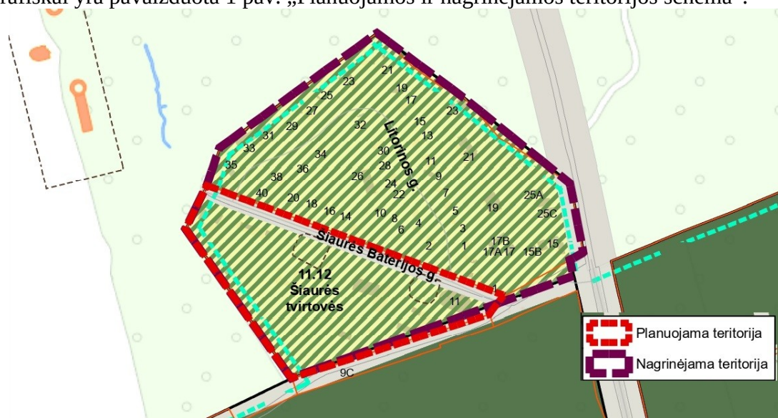
1 pav. Planuojamos ir nagrinėjamos teritorijos schema

3. Nagrinėjama (numatomų sprendinių įtaką patirianti) teritorija: vadovaujantis Klaipėdos miesto bendroju planu, patvirtintu Klaipėdos miesto savivaldybės tarybos 2021 m. rugsėjo 30 d. sprendimu Nr. T2-191 „Dėl Klaipėdos miesto bendrojo plano keitimo patvirtinimo“, apima 11.12 Šiaurės tvirtovės nagrinėjamo rajono ribas. Bendrojo plano sprendiniai yra paspaudus šią nuorodą: https://www.klaipeda.lt/lt/savivaldybe/administracija/miesto-bendrasis-planas/218 . Nagrinėjama teritorija grafiškai yra pavaizduota 1 pav. „Planuojamos ir nagrinėjamos teritorijos schema“.