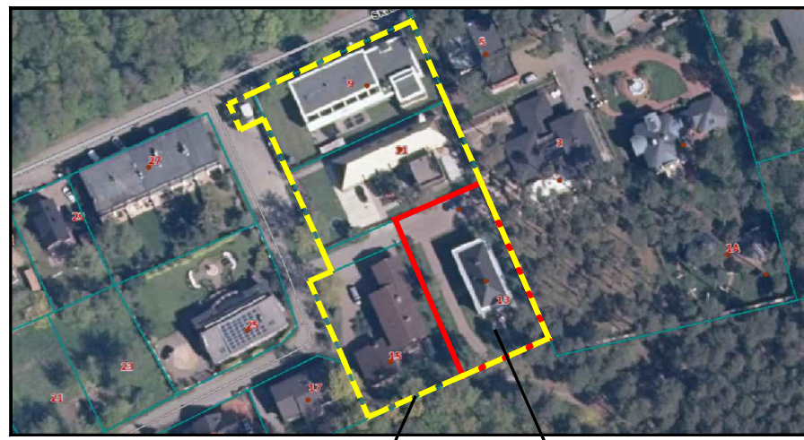
Koreguojamo DP riba