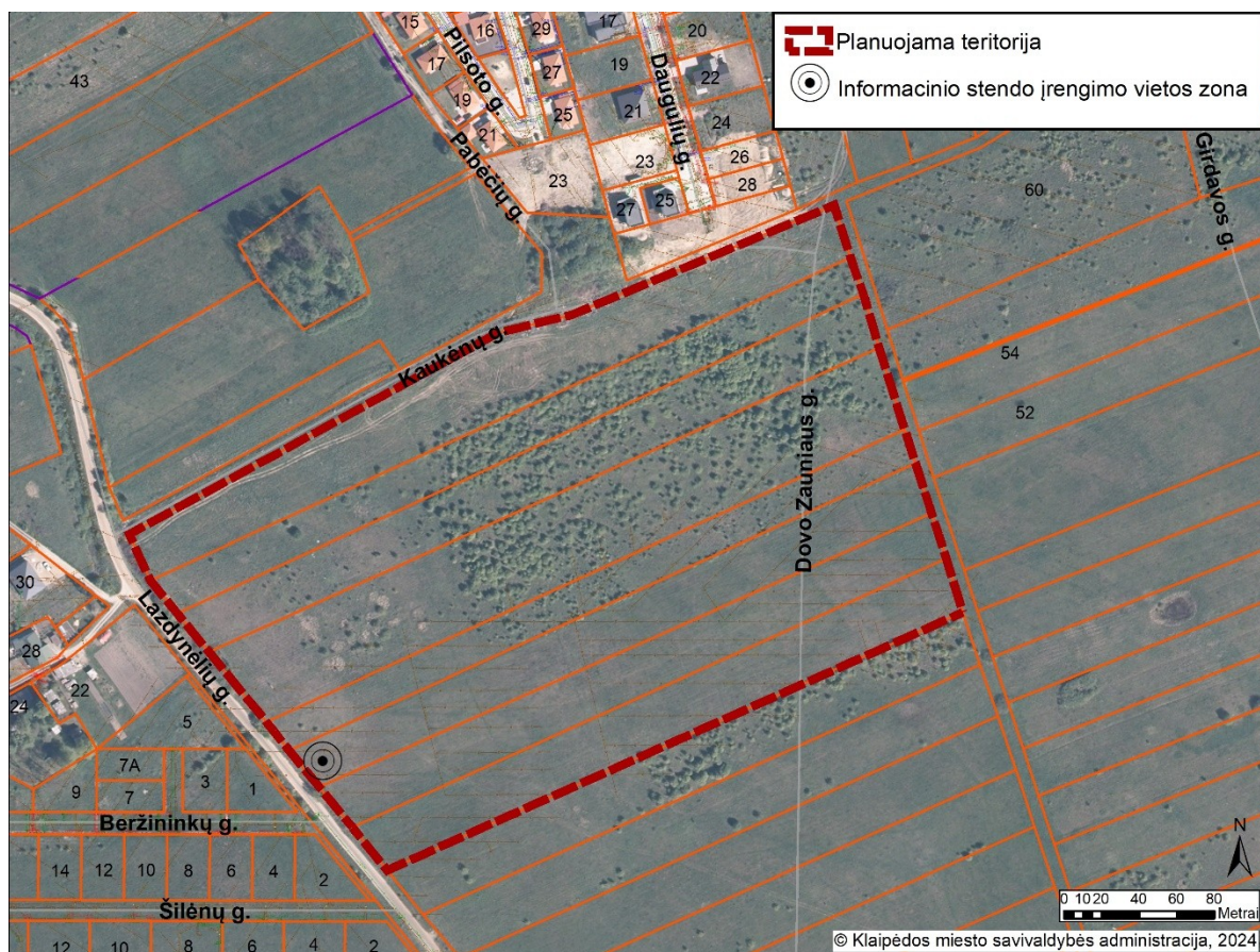
2 pav. Informacinio stendo vieta

19.2. detaliojo plano iniciatorius yra atsakingas už informacinio stendo įrengimą, priežiūrą viso detaliojo plano proceso metu. Taip pat turi užtikrinti informacinio stendo vizualinius, turinio ir konstrukcinius kokybės reikalavimus. Informacinis stendas turi būti pagamintas iš aplinkos poveikiui atsparių ir kokybiškų medžiagų. Informaciniame stende pateikiama informacija (tekstinė ir grafinė dalis) ne mažesniame kaip A2 formato lape (594 x 420 mm), kad tilptų visa Lietuvos Respublikos teritorijų planavimo įstatyme ir Visuomenės informavimo, konsultavimo ir dalyvavimo priimant sprendimus dėl teritorijų planavimo nuostatuose, patvirtintuose Lietuvos Respublikos Vyriausybės 1996 m. rugsėjo 18 d. nutarimu Nr. 1079, nurodyta skelbtina informacija. Informacija stende turi būti pateikta aiškiai, įskaitomai ir be gramatinių klaidų. Informacinis stendas turi būti įrengiamas 2 pav. „Informacinio stendo vieta“ nurodytoje zonoje, įvertinus konkrečios vietos inžinerinius tinklus, susisiekimo komunikacijas, reljefą, esamus želdinius ir statinius.