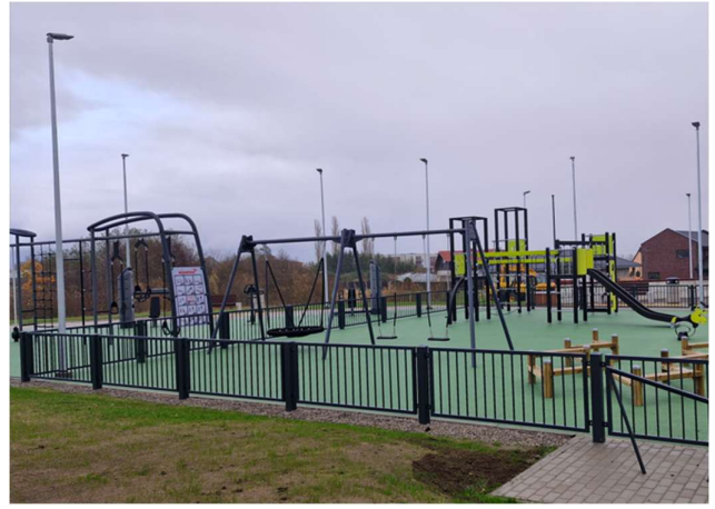
2024-12 mėn. Paupių vaikų ir sporto aikštelė jau baigta !!!