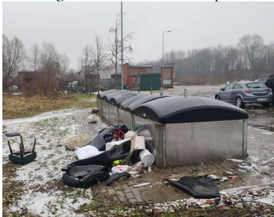
Nėra stebėjimo kameros