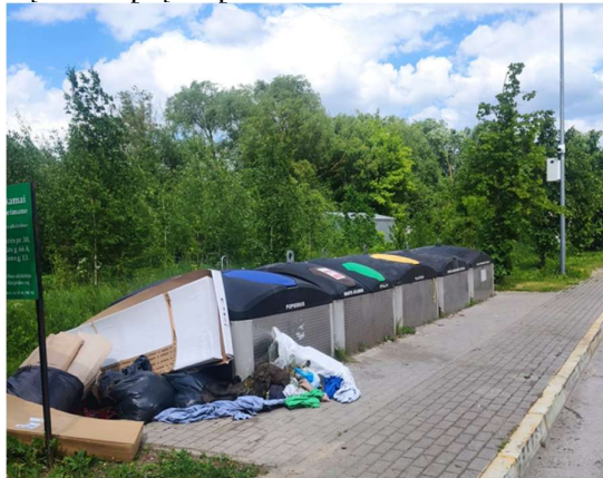
Yra stebėjimo kamera