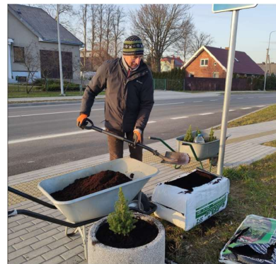
Paupių rajonas pasipuošęs gyventojų sodintomis gėlėmis