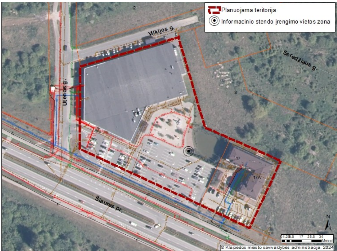
2 pav. Informacinio stendo vieta

19.2. detaliojo plano iniciatorius yra atsakingas už informacinio stendo įrengimą, priežiūrą viso detaliojo plano proceso metu. Taip pat turi užtikrinti informacinio stendo vizualinius, turinio ir konstrukcinius kokybės reikalavimus. Informacinis stendas turi būti pagamintas iš aplinkos poveikiui atsparių ir kokybiškų medžiagų. Informaciniame stende pateikiama informacija (tekstinė ir grafinė dalis) ne mažesniame kaip A2 formato lape (594 x 420 mm), kad tilptų visa Lietuvos Respublikos teritorijų planavimo įstatyme ir Visuomenės informavimo, konsultavimo ir dalyvavimo priimant sprendimus dėl teritorijų planavimo nuostatuose, patvirtintuose Lietuvos Respublikos Vyriausybės 1996 m. rugsėjo 18 d. nutarimu Nr. 1079, nurodyta skelbtina informacija. Informacija stende turi būti pateikta aiškiai, įskaitomai ir be gramatinių klaidų. Informacinis stendas turi būti įrengiamas 2 pav. „Informacinio stendo vieta“ nurodytoje zonoje, įvertinus konkrečios vietos inžinerinius tinklus, susisiekimo komunikacijas, reljefą, esamus želdinius ir statinius.