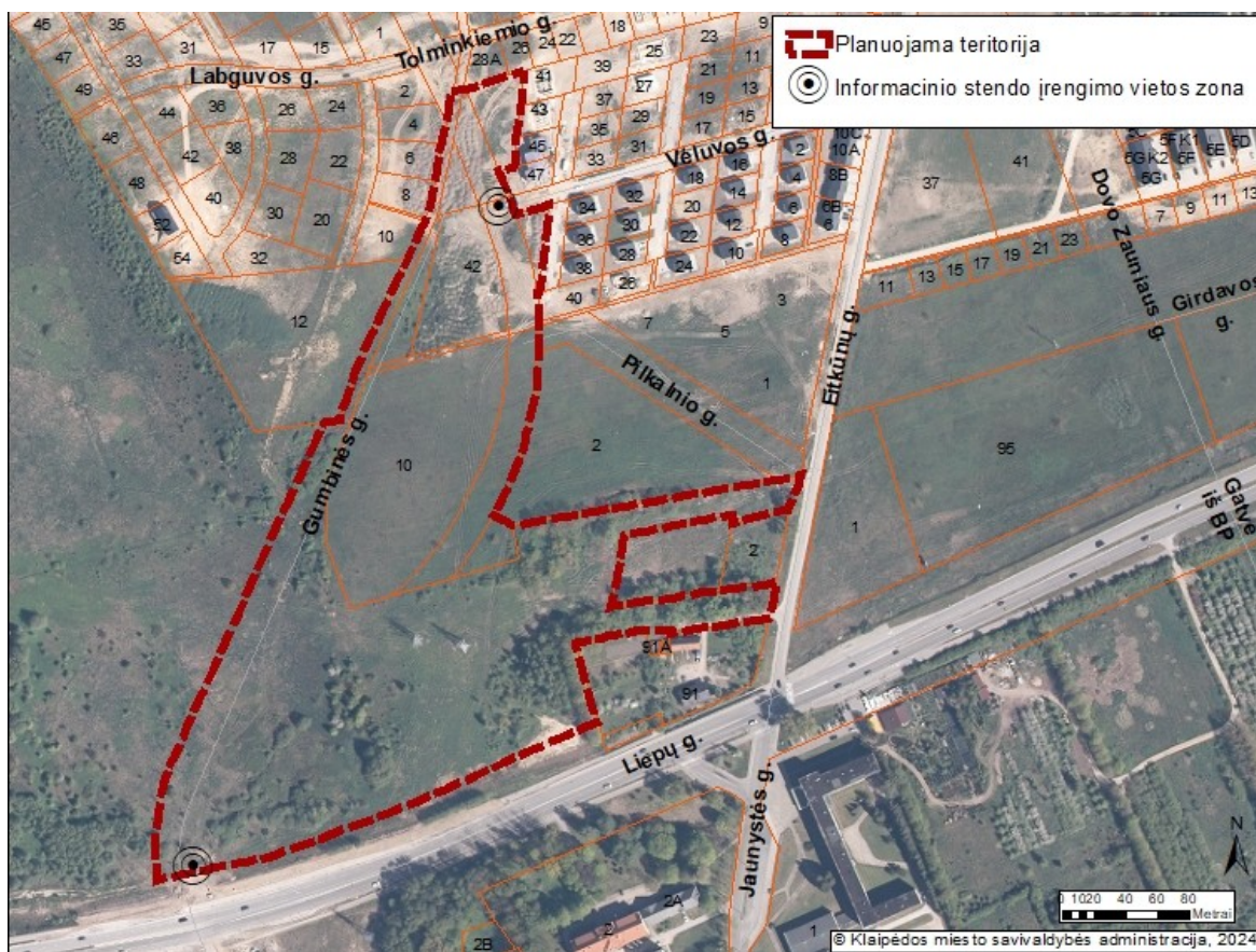
2 pav. Informacinio stendo vieta

19.1. planavimo iniciatorius ar detaliojo plano rengėjas, suderinęs su Klaipėdos miesto savivaldybės administracijos Urbanistikos ir architektūros departamento Urbanistikos skyriumi, privalo užtikrinti tinkamą teritorijų planavimo dokumento viešinimo, informacijos teikimo, susipažinimo su parengtu teritorijų planavimo dokumentu, pasiūlymų teikimo ir nagrinėjimo, viešo svarstymo procedūrų vykdymą, taip kaip tai numato teisės aktai;