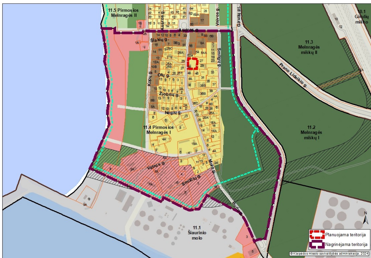
1 pav. Planuojamos ir nagrinėjamos teritorijos schema

3. Nagrinėjama (numatomų sprendinių įtaką patirianti) teritorija: vadovaujantis Klaipėdos miesto bendrojo planu, patvirtintu Klaipėdos miesto savivaldybės tarybos 2021 m. rugsėjo 30 d. sprendimu Nr. T2-191 „Dėl Klaipėdos miesto bendrojo plano keitimo patvirtinimo“, apima 11.4 Pirmosios Melnragės I ribas. Bendrojo plano sprendiniai yra paspaudus šią nuorodą: https://www.klaipeda.lt/lt/savivaldybe/administracija/miesto-bendrasis-planas/218 . Nagrinėjama teritorija grafiškai yra pavaizduota 1 pav. „Planuojamos ir nagrinėjamos teritorijos schema“.