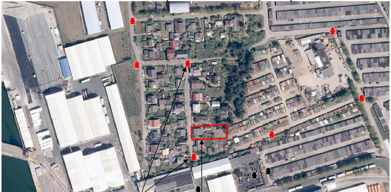
Ištrauka iš AB „Klaipėdos vanduo“ hidrantų žemėlapiu