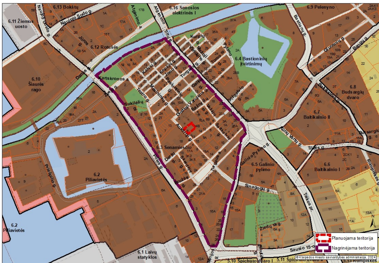
1 pav. Planuojamos ir nagrinėjamos teritorijos schema

3. Nagrinėjama (numatomų sprendinių įtaką patirianti) teritorija: vadovaujantis Klaipėdos miesto bendroju planu, patvirtintu Klaipėdos miesto savivaldybės tarybos 2021 m. rugsėjo 30 d. sprendimu Nr. T2-191 „Dėl Klaipėdos miesto bendrojo plano keitimo patvirtinimo“, apima 6.3 Senamiesčio nagrinėjamo rajono ribas. Bendrojo plano sprendiniai yra paspaudus šią nuorodą: https://www.klaipeda.lt/lt/savivaldybe/administracija/miesto-bendrasis-planas/218 .