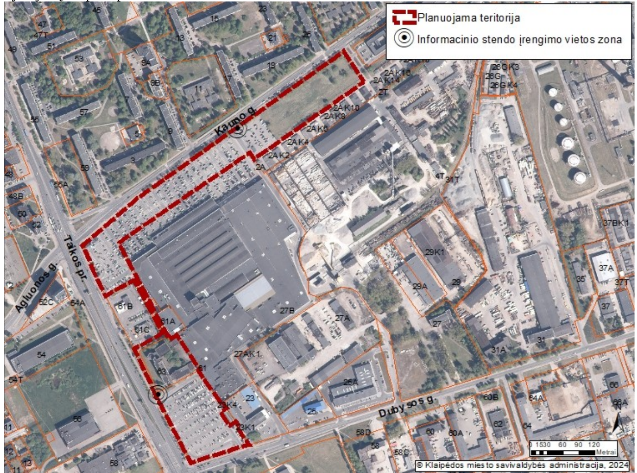
2 pav. „Informacinio stendo vieta“

19.1. planavimo iniciatorius ar detaliojo plano korektūros rengėjas, suderinęs su Klaipėdos miesto savivaldybės administracijos Urbanistikos ir architektūros skyriumi, privalo užtikrinti tinkamą teritorijų planavimo dokumento viešinimo, informacijos teikimo, susipažinimo su parengtu teritorijų planavimo dokumentu, pasiūlymų teikimo ir nagrinėjimo, viešo svarstymo procedūrų vykdymą, taip kaip tai numato teisės aktai;