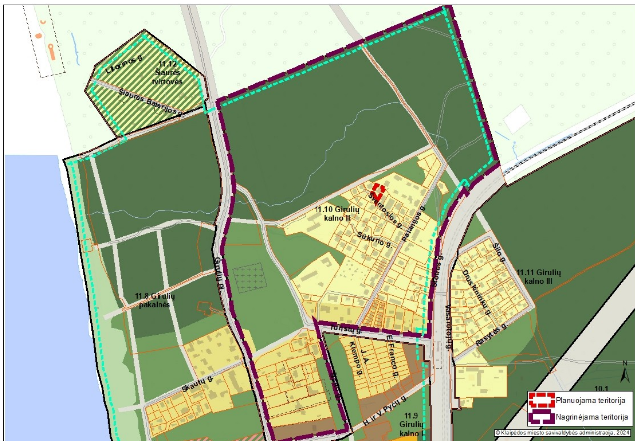
1 pav. Planuojamos ir nagrinėjamos teritorijos schema

3. Nagrinėjama (numatomų sprendinių įtaką patirianti) teritorija: vadovaujantis Klaipėdos miesto bendroju planu, patvirtintu Klaipėdos miesto savivaldybės tarybos 2021 m. rugsėjo 30 d. sprendimu Nr. T2-191 „Dėl Klaipėdos miesto bendrojo plano keitimo patvirtinimo“, apima 11.10 Girulių kalno II ribas. Bendrojo plano sprendiniai yra paspaudus šią nuorodą: https://www.klaipeda.lt/lt/savivaldybe/administracija/miesto-bendrasis-planas/218 . Nagrinėjama teritorija grafiškai yra pavaizduota 1 pav. „Planuojamos ir nagrinėjamos teritorijos schema“.