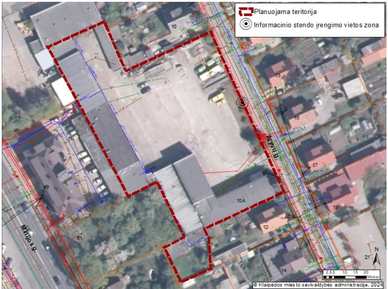
2 pav. „Informacinio stendo vieta“

19.2. detaliojo plano iniciatorius yra atsakingas už informacinio stendo įrengimą, priežiūrą viso detaliojo plano proceso metu. Taip pat turi užtikrinti informacinio stendo vizualinius, turinio ir konstrukcinius kokybės reikalavimus. Informacinis stendas turi būti pagamintas iš aplinkos poveikiui atsparių ir kokybiškų medžiagų. Informaciniame stende pateikiama informacija (tekstinė ir grafinė dalis) ne mažesniame kaip A2 formato lape (594 x 420 mm), kad tilptų visa Lietuvos Respublikos teritorijų planavimo įstatyme ir Visuomenės informavimo, konsultavimo ir dalyvavimo priimant sprendimus dėl teritorijų planavimo nuostatuose, patvirtintuose Lietuvos Respublikos Vyriausybės 1996 m. rugsėjo 18 d. nutarimu Nr. 1079, nurodyta skelbtina informacija. Informacija stende turi būti pateikta aiškiai, įskaitomai ir be gramatinių klaidų. Informacinis stendas turi būti įrengiamas 1 pav. „Informacinio stendo vieta“ nurodytoje zonoje, įvertinus konkrečios vietos inžinerinius tinklus, susisiekimo komunikacijas, reljefą, esamus želdinius ir statinius.