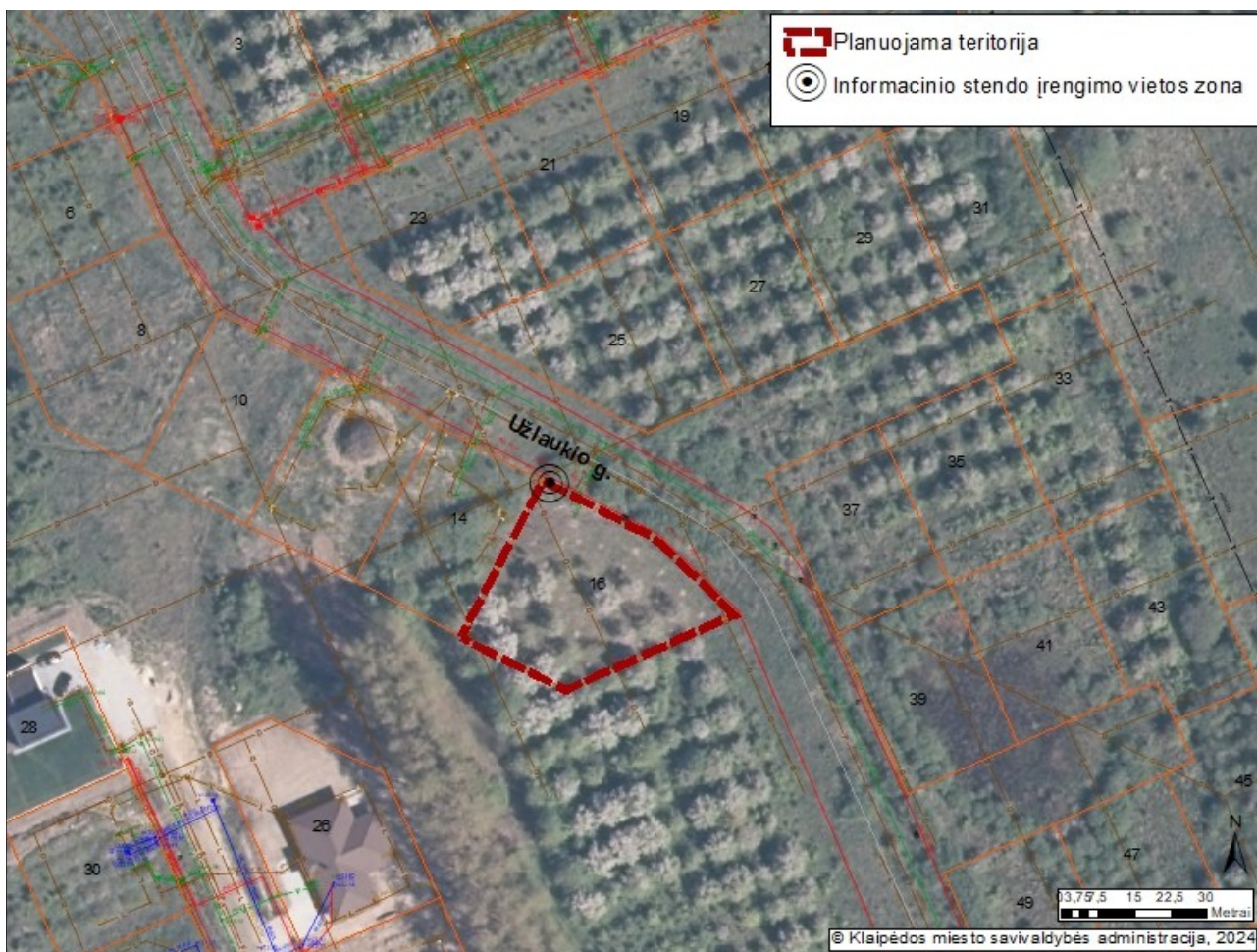
2 pav. „Informacinio stendo vieta“

19.2. detaliojo plano iniciatorius yra atsakingas už informacinio stendo įrengimą, priežiūrą viso detaliojo plano proceso metu. Taip pat turi užtikrinti informacinio stendo vizualinius, turinio ir konstrukcinius kokybės reikalavimus. Informacinis stendas turi būti pagamintas iš aplinkos poveikiui atsparių ir kokybiškų medžiagų. Informaciniame stende pateikiama informacija (tekstinė ir grafinė dalis) ne mažesniame kaip A2 formato lape (594 x 420 mm), kad tilptų visa Lietuvos Respublikos teritorijų planavimo įstatyme ir Visuomenės informavimo, konsultavimo ir dalyvavimo priimant sprendimus dėl teritorijų planavimo nuostatuose, patvirtintuose Lietuvos Respublikos Vyriausybės 1996 m. rugsėjo 18 d. nutarimu Nr. 1079, nurodyta skelbtina informacija. Informacija stende turi būti pateikta aiškiai, įskaitomai ir be gramatinių klaidų. Informacinis stendas turi būti įrengiamas 1 pav. „Informacinio stendo vieta“ nurodytoje zonoje, įvertinus konkrečios vietos inžinerinius tinklus, susisiekimo komunikacijas, reljefą, esamus želdinius ir statinius.