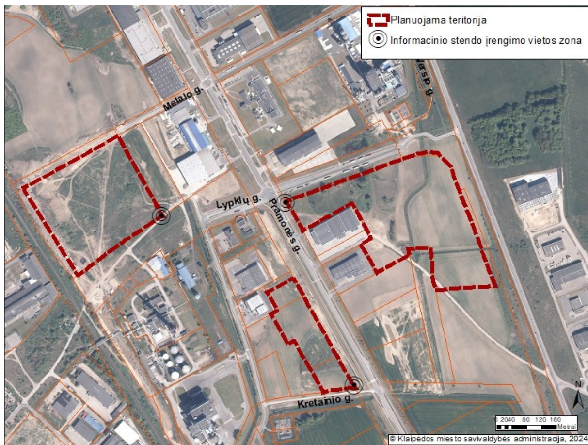
2 pav. „Informacinio stendo vieta“

19.2. detaliojo plano iniciatorius yra atsakingas už informacinio stendo įrengimą, priežiūrą viso detaliojo plano proceso metu. Taip pat turi užtikrinti informacinio stendo vizualinius, turinio ir konstrukcinius kokybės reikalavimus. Informacinis stendas turi būti pagamintas iš aplinkos poveikiui atsparių ir kokybiškų medžiagų. Informaciniame stende pateikiama informacija (tekstinė ir grafinė dalis) ne mažesniame kaip A2 formato lape (594 x 420 mm), kad tilptų visa Lietuvos Respublikos teritorijų planavimo įstatyme ir Visuomenės informavimo, konsultavimo ir dalyvavimo priimant sprendimus dėl teritorijų planavimo nuostatuose, patvirtintuose Lietuvos Respublikos Vyriausybės 1996 m. rugsėjo 18 d. nutarimu Nr. 1079, nurodyta skelbtina informacija. Informacija stende turi būti pateikta aiškiai, įskaitomai ir be gramatinių klaidų. Informacinis stendas turi būti įrengiamas 1 pav. „Informacinio stendo vieta“ nurodytoje zonoje, įvertinus konkrečios vietos inžinerinius tinklus, susisiekimo komunikacijas, reljefą, esamus želdinius ir statinius.