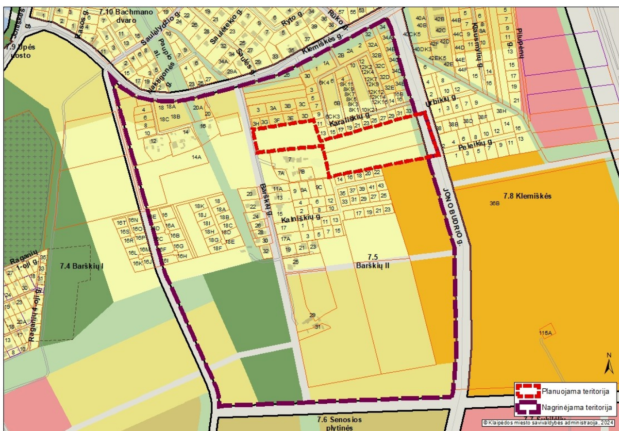
1 pav. Planuojamos ir nagrinėjamos teritorijos schema

3. Nagrinėjama (numatomų sprendinių įtaką patirianti) teritorija: vadovaujantis Klaipėdos miesto bendrojo planu, patvirtintu Klaipėdos miesto savivaldybės tarybos 2021 m. rugsėjo 30 d. sprendimu Nr. T2-191 „Dėl Klaipėdos miesto bendrojo plano keitimo patvirtinimo“, apima 7.5 Barškių II nagrinėjamo rajono ribas. Bendrojo plano sprendiniai yra paspaudus šią nuorodą: https://www.klaipeda.lt/lt/savivaldybe/administracija/miesto-bendrasis-planas/218 .