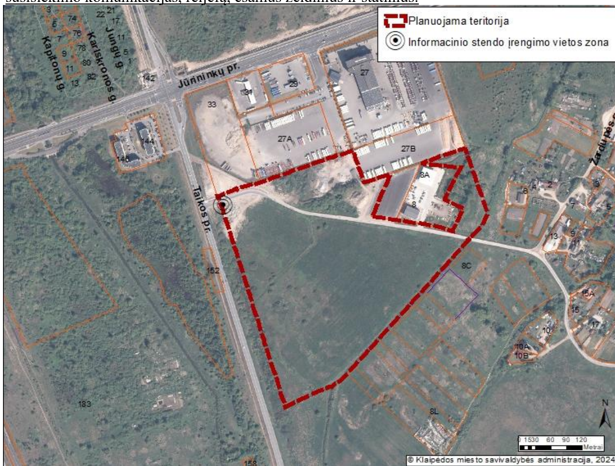
2 pav. Informacinio stendo vieta

19.2. detaliojo plano iniciatorius yra atsakingas už informacinio stendo įrengimą, priežiūrą viso detaliojo plano proceso metu. Taip pat turi užtikrinti informacinio stendo vizualinius, turinio ir konstrukcinius kokybės reikalavimus. Informacinis stendas turi būti pagamintas iš aplinkos poveikiui atsparių ir kokybiškų medžiagų. Informaciniame stende pateikiama informacija (tekstinė ir grafinė dalis) ne mažesniame kaip A2 formato lape (594 x 420 mm), kad tilptų visa Lietuvos Respublikos teritorijų planavimo įstatyme ir Visuomenės informavimo, konsultavimo ir dalyvavimo priimant sprendimus dėl teritorijų planavimo nuostatuose, patvirtintuose Lietuvos Respublikos Vyriausybės 1996 m. rugsėjo 18 d. nutarimu Nr. 1079, nurodyta skelbtina informacija. Informacija stende turi būti pateikta aiškiai, įskaitomai ir be gramatinių klaidų. Informacinis stendas turi būti įrengiamas 2 pav. „Informacinio stendo vieta“ nurodytoje zonoje, įvertinus konkrečios vietos inžinerinius tinklus, susisiekimo komunikacijas, reljefą, esamus želdinius ir statinius.