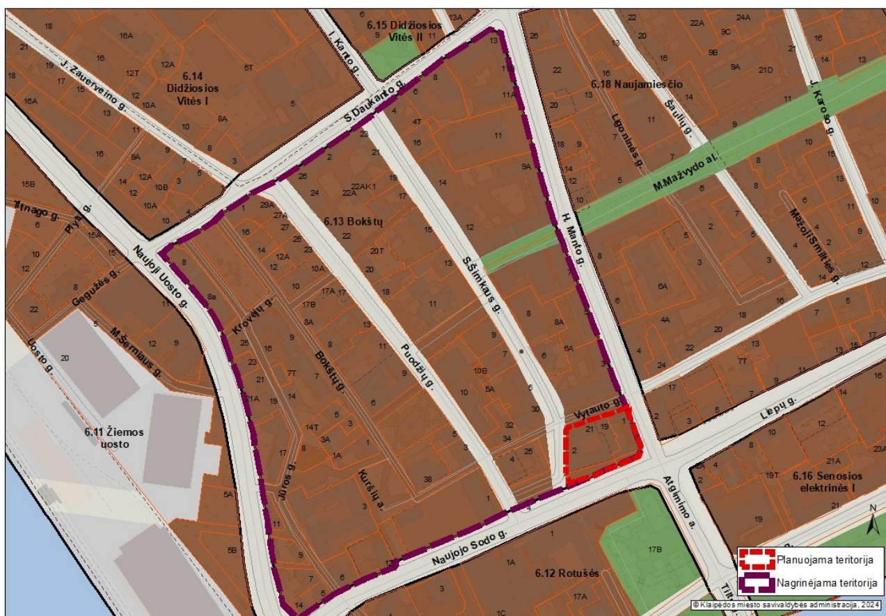
1 pav. Planuojamos ir nagrinėjamos teritorijos schema

3. Nagrinėjama (numatomų sprendinių įtaką patirianti) teritorija: vadovaujantis Klaipėdos miesto bendroju planu, patvirtintu Klaipėdos miesto savivaldybės tarybos 2021 m. rugsėjo 30 d. sprendimu Nr. T2-191 „Dėl Klaipėdos miesto bendrojo plano keitimo patvirtinimo“, apima 6.13 Bokštų nagrinėjamo rajono ribas. Bendrojo plano sprendiniai yra paspaudus šią nuorodą: https://www.klaipeda.lt/lt/savivaldybe/administracija/miesto-bendrasis-planas/218 .