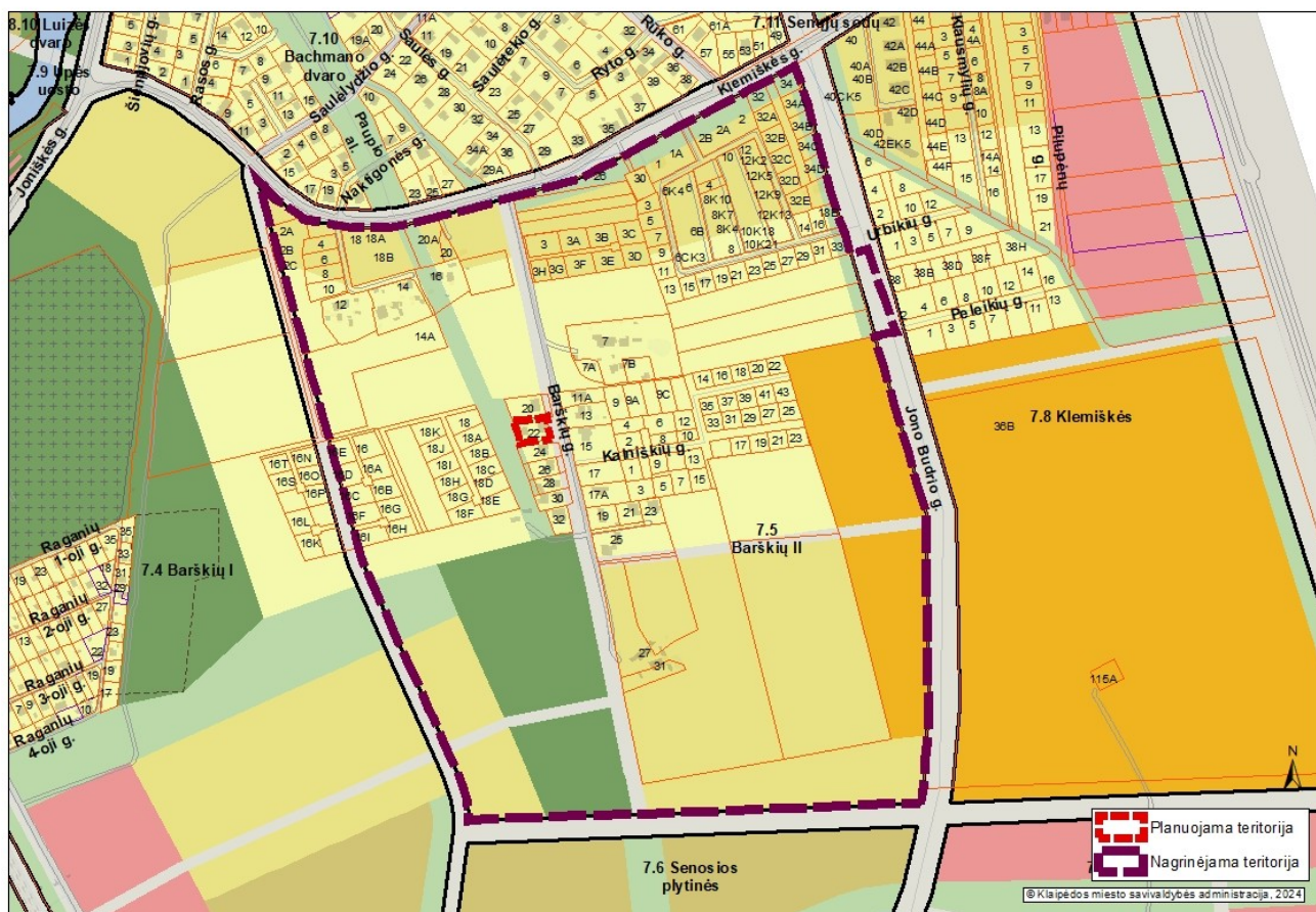
1 pav. Planuojamos ir nagrinėjamos teritorijos schema

3. Nagrinėjama (numatomų sprendinių įtaką patirianti) teritorija: vadovaujantis Klaipėdos miesto bendroju planu, patvirtintu Klaipėdos miesto savivaldybės tarybos 2021 m. rugsėjo 30 d. sprendimu Nr. T2-191 „Dėl Klaipėdos miesto bendrojo plano keitimo patvirtinimo“, apima 7.5 Barškių II ribas. Bendrojo plano sprendiniai yra paspaudus šią nuorodą: https://www.klaipeda.lt/lt/savivaldybe/administracija/miesto-bendrasis-planas/218 . Nagrinėjama teritorija grafiškai yra pavaizduota 1 pav. „Planuojamos ir nagrinėjamos teritorijos schema“.