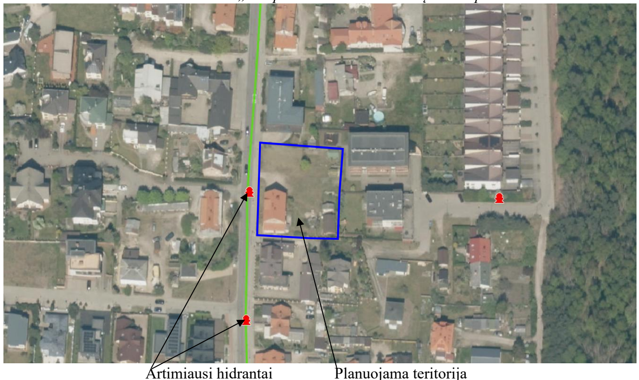
Ištrauka iš AB „Klaipėdos vanduo“ hidrantų žemėlapis

Vadovaujantis Gaisrinės saugos normų teritorijų planavimo dokumentams rengti 11 punktu, detaliojo plano sprendiniai sudaro galimybę rengiant statinių techninius projektus įgyvendinti Gaisrinės saugos pagrindiniuose reikalavimuose numatytas sąlygas gaisrų gesinimo ir gelbėjimo automobiliams privažiuoti prie kiekvieno statinio, gaisro gesinimo vandens šaltinio ir gaisrinio hidranto.