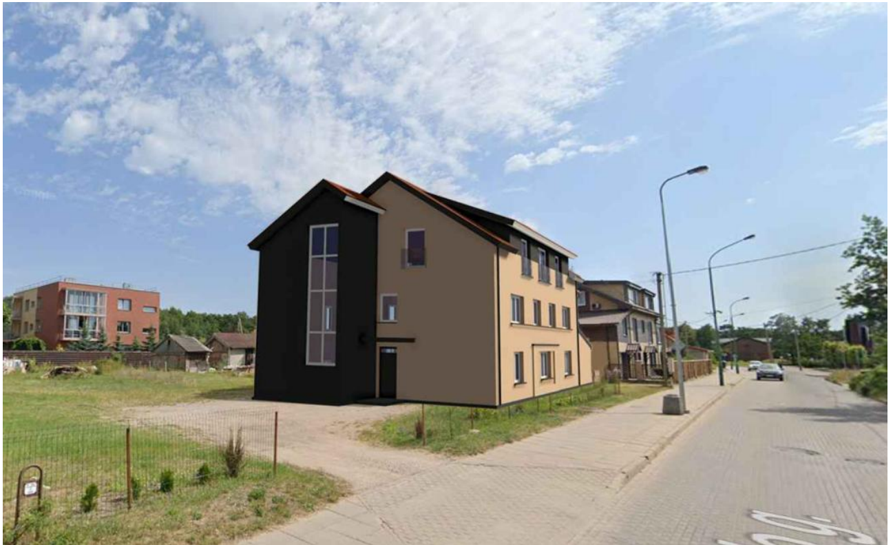
Vaizdas su gretimu užstatymu iš šiaurės vakarų pusės