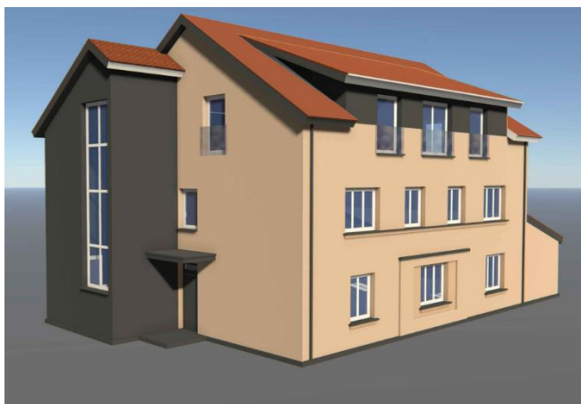
Vaizdas iš šiaurės vakarų pusės