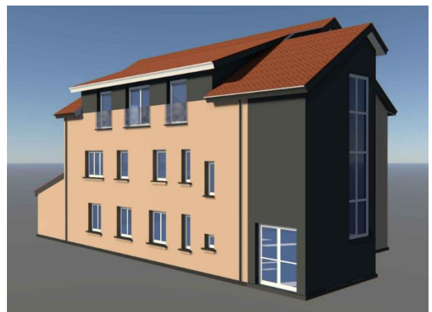
Vaizdas iš šiaurės rytų pusės