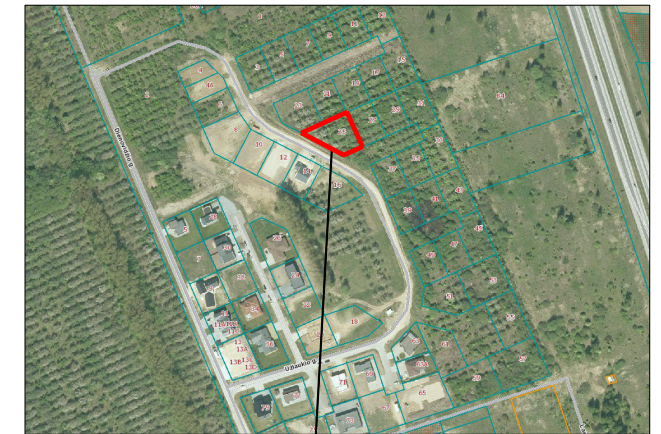
Planuojamas žemės sklypas

PASTABOS: Vadovaujantis LR Teritorijų planavimo įstatymo 28 str. 9 d. bei Kompleksinio teritorijų planavimo dokumentų rengimo taisyklių (toliau - Taisyklių) 318.3, 318.3.1 punktais, rengiamas 2003-01-16 sprendimu Nr. 6 patvirtinto detaliojo plano koregavimas, žemės sklypui Užlaukio g. 25, Klaipėdos m. (kad. Nr. 2101/0036:604). Koreguojama detalijame plane pažymėtame žemės sklype Nr. 15 statybos zona ir statybos riba. Nekeičiant detalioju planu nustatytų privalomųjų teritorijos tvarkymo ir naudojimo režimų ir nesukeliant naujų neigiamų padarinių gyvenimo ir aplinkos kokybei, nepažeidžia trečiųjų asmenų interesų.