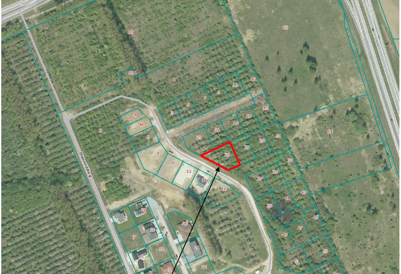
Planuojamas žemės sklypas Užlaukio g. 25, Klaipėdoje.

1.1. Detaliojo plano iniciatorius. Fizinis asmuo (duomenys nuasmeninti).