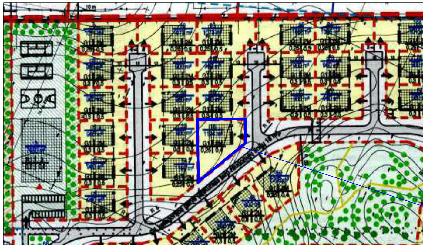
Planuojamas žemės sklypas Užlaukio g. 25, Klaipėdos m. detalijame plane pažymėtas Nr. 15.