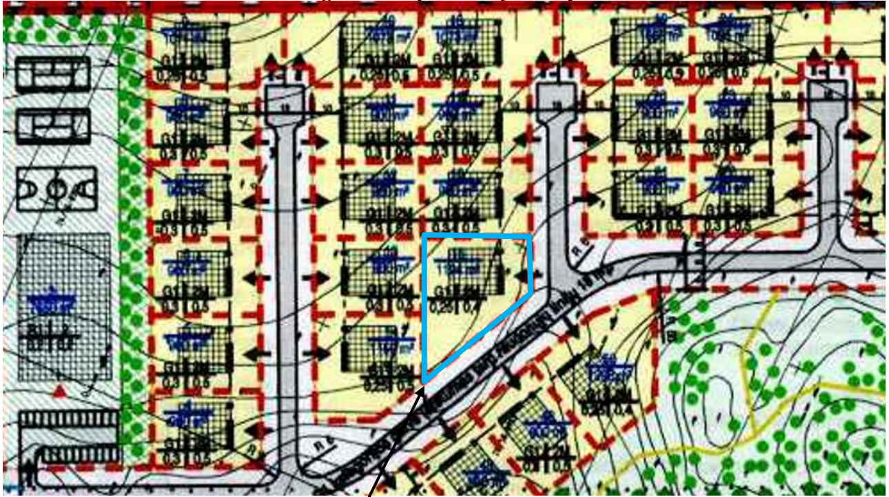
Planuojamas žemės sklypas detaliojame plane pažymėtas Nr. 15