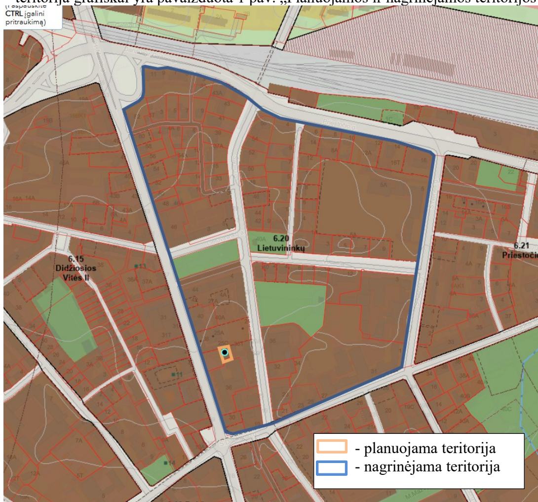
1 pav. Planuojamos ir nagrinėjamos teritorijos schema

3. Nagrinėjama (numatomų sprendinių įtaką patirianti) teritorija: vadovaujantis Klaipėdos miesto bendroju planu, patvirtintu Klaipėdos miesto savivaldybės tarybos 2021 m. rugsėjo 30 d. sprendimu Nr. T2-191 „Dėl Klaipėdos miesto bendrojo plano keitimo patvirtinimo“, apima 6.20 Lietuvininkų ribas. Bendrojo plano sprendiniai yra paspaudus šią nuorodą: https://www.klaipeda.lt/lt/savivaldybe/administracija/miesto-bendrasis-planas/218 . Nagrinėjama teritorija grafiškai yra pavaizduota 1 pav. „Planuojamos ir nagrinėjamos teritorijos schema“.