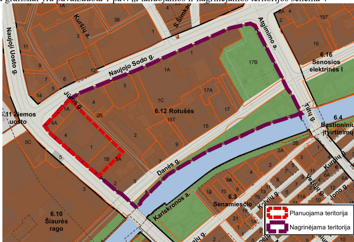
1 pav. Planuojamos ir nagrinėjamos teritorijos schema

3. Nagrinėjama (numatomų sprendinių įtaką patirianti) teritorija: vadovaujantis Klaipėdos miesto bendroju planu, patvirtintu Klaipėdos miesto savivaldybės tarybos 2021 m. rugsėjo 30 d. sprendimu Nr. T2-191 „Dėl Klaipėdos miesto bendrojo plano keitimo patvirtinimo“, apima 6.12 Rotušės nagrinėjamo rajono ribas. Bendrojo plano sprendiniai yra paspaudus šią nuorodą: https://www.klaipeda.lt/lt/savivaldybe/administracija/miesto-bendrasis-planas/218 . Nagrinėjama teritorija grafiškai yra pavaizduota 1 pav. „Planuojamos ir nagrinėjamos teritorijos schema“.