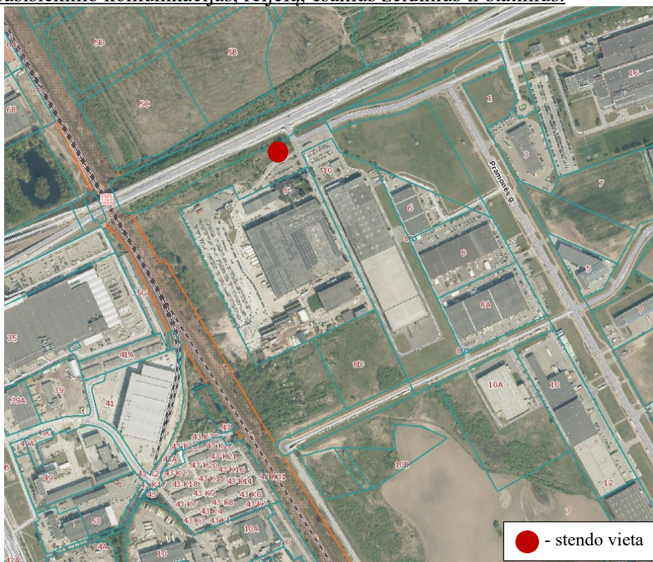
2 pav. Informacinio stendo vieta

18.2. detaliojo plano iniciatorius yra atsakingas už informacinio stendo įrengimą, priežiūrą viso detaliojo plano proceso metu. Taip pat turi užtikrinti informacinio stendo vizualinius, turinio ir konstrukcinius kokybės reikalavimus. Informacinis stendas turi būti pagamintas iš aplinkos poveikiui atsparių ir kokybiškų medžiagų. Informaciniame stende pateikiama informacija (tekstinė ir grafinė dalis) ne mažesniame kaip A2 formato lape (594 x 420 mm), kad tilptų visa Lietuvos Respublikos teritorijų planavimo įstatyme ir Visuomenės informavimo, konsultavimo ir dalyvavimo priimančios sprendimus dėl teritorijų planavimo nuostatuose, patvirtintuose Lietuvos Respublikos Vyriausybės 1996 m. rugsėjo 18 d. nutarimu Nr. 1079, nurodyta skelbtina informacija. Informacija stende turi būti pateikta aiškiai, įskaitomai ir be gramatinių klaidų. Informacinis stendas turi būti įrengiamas 2 pav. „Informacinio stendo vieta“ nurodytoje zonoje, įvertinus konkrečios vietos inžinerinius tinklus, susisiekimo komunikacijas, reljefą, esamus želdinius ir statinius.