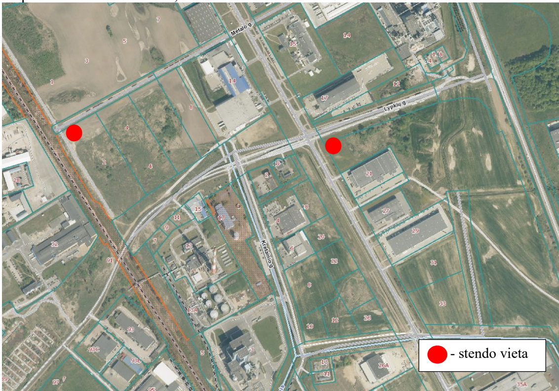
2 pav. „Informacinio stendo vieta“