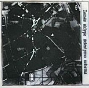
Zemes sklypo fotografavimo schema