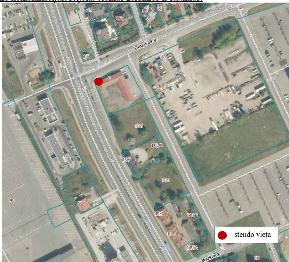
2 pav. Informacinio stendo vieta

18.2. detaliojo plano iniciatorius yra atsakingas už informacinio stendo įrengimą, priežiūrą viso detaliojo plano proceso metu. Taip pat turi užtikrinti informacinio stendo vizualinius, turinio ir konstrukcinius kokybės reikalavimus. Informacinis stendas turi būti pagamintas iš aplinkos poveikiui atsparių ir kokybiškų medžiagų. Informaciniame stende pateikiama informacija (tekstinė ir grafinė dalis) ne mažesniame kaip A2 formato lape (594 x 420 mm), kad tilptų visa Lietuvos Respublikos teritorijų planavimo įstatyme ir Visuomenės informavimo, konsultavimo ir dalyvavimo priimant sprendimus dėl teritorijų planavimo nuostatuose, patvirtintuose Lietuvos Respublikos Vyriausybės 1996 m. rugsėjo 18 d. nutarimu Nr. 1079, nurodyta skelbtina informacija. Informacija stende turi būti pateikta aiškiai, įskaitomai ir be gramatinių klaidų. Informacinis stendas turi būti įrengiamas 2 pav. „Informacinio stendo vieta“ nurodytoje zonoje, įvertinus konkrečios vietos inžinerinius tinklus, susisiekimo komunikacijas, reljefą, esamus želdinius ir statinius.