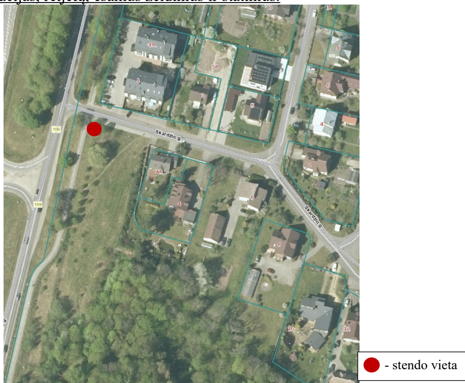
2 pav. Informacinio stendo vieta

18.2. detaliojo plano iniciatorius yra atsakingas už informacinio stendo įrengimą, priežiūrą viso detaliojo plano proceso metu. Taip pat turi užtikrinti informacinio stendo vizualinius, turinio ir konstrukcinius kokybės reikalavimus. Informacinis stendas turi būti pagamintas iš aplinkos poveikiui atsparių ir kokybiškų medžiagų. Informaciniame stende pateikiama informacija (tekstinė ir grafinė dalis) ne mažesniame kaip A2 formato lape (594 x 420 mm), kad tilptų visa Lietuvos Respublikos teritorijų planavimo įstatyme ir Visuomenės informavimo, konsultavimo ir dalyvavimo priimant sprendimus dėl teritorijų planavimo nuostatuose, patvirtintuose Lietuvos Respublikos Vyriausybės 1996 m. rugsėjo 18 d. nutarimu Nr. 1079, nurodyta skelbtina informacija. Informacija stende turi būti pateikta aiškiai, įskaitomai ir be gramatinių klaidų. Informacinis stendas turi būti įrengiamas 2 pav. „Informacinio stendo vieta“ nurodytoje zonoje, įvertinus konkrečios vietos inžinerinius tinklus, susisiekimo komunikacijas, reljefą, esamus želdinius ir statinius.