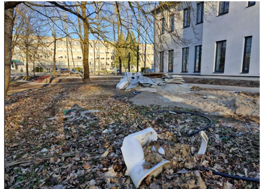
Teritorija prie Jaunystės g. 2A

2025-03-24 išsiunčiau raštą į KMSA „Dėl Klaipėdos rajono specialiojo plano, tikslu sumažinti eismo kamščius“. Vienas iš sprendinių- įrengti naują autotransporto jungtį Klemiškės gatvė - Klaipėdos rajonas per magistralinį kelią A13. Rašte nurodžiau Paupių gyventojų nesutikimą su teikiamais sprendiniais ir teikiau 3 sprendinius kaip spręsti eismo mažinimo kamščius mažinant transporto srautus Liepų gatvėje.