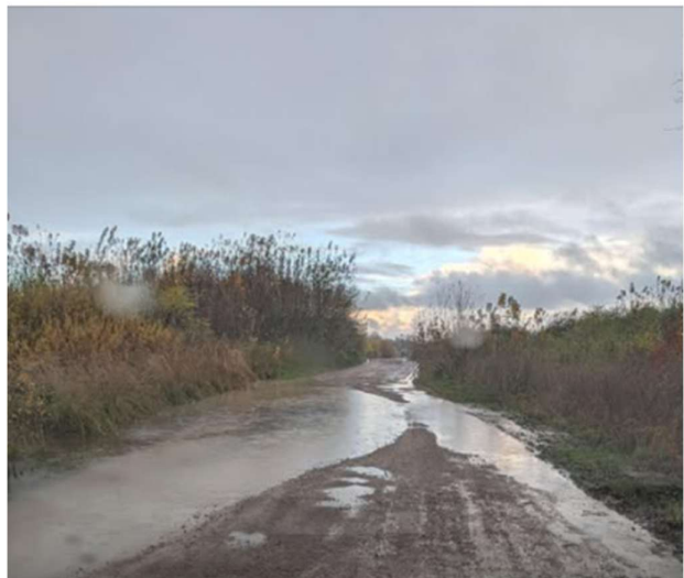
Žvyruota Jaunystės g. dalis po lietaus