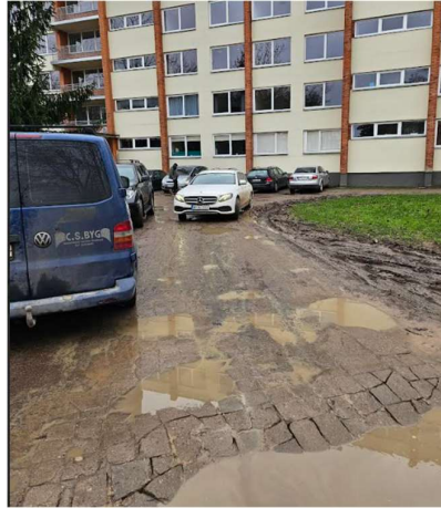
Mašinos statomos pėstiesiems skirtoje aikštelėje