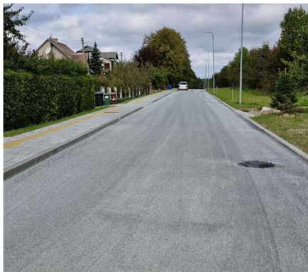
Obelų g. po rekonstrukcijos