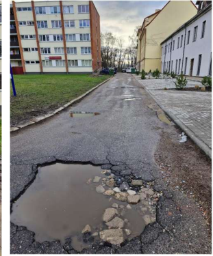
Privažiavimo link Jaunystės g. 4 ir 2A asfalto danga yra stipriai pažeista