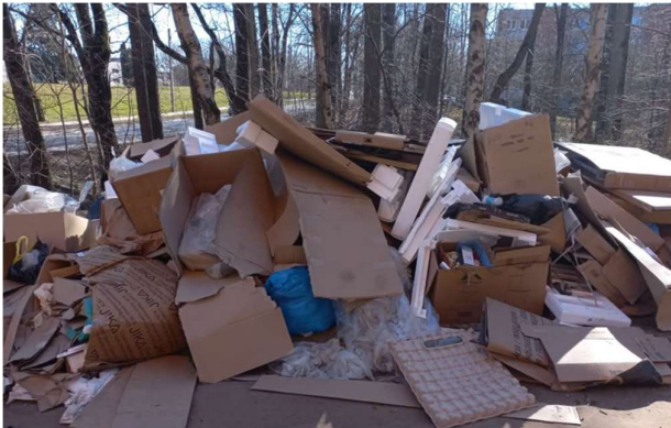
Teritorija prie Jaunystės g. 4