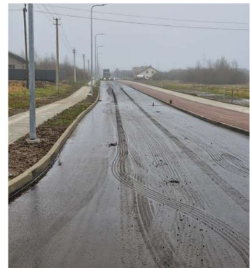
Barškių g. po rekonstrukcijos

2025-01-06 Klaipėdos m. savivaldybei (toliau tekste – KMSA) raštu pateikiau 19 punktų siūlymus Klaipėdos m. 2025-2027 m. strateginiam veiklos planui (SVP). Siūlymai parengti atsižvelgiant į gyventojų poreikius. Apie tai informavau gyventojus Fb Paupiai.Klaipėda. Pagrindiniai siūlymai šiems darbams: Saulėtekio g., Saulėlydžio g. dalies ir Ryto g. apšvietimo įrengimas; Bičiulių g. ir Jaunystės g. dalies rekonstrukcija; Rūko g. (pagrindinės) kapitalinis remontas; Jaunystės g. – Rūko g. sankryžos rekonstrukcija; viešojo transporto sustojimo vietose įrengti paviljonai; ikimokyklinio amžiaus ir pradinio mokymo švietimo įstaigos įsteigimas; Klemiškės g. - Joniškės g. sankryžoje ratelio įrengimas; Bendruomenės namų įrengimas Paupiuose; Paupių parko medžių stovio įvertinimas ir sutvarkymas; triukšmo užtvaros įrengimas nuo Palangos plento; inicijuoti Klaipėdos valstybinės kolegijos pastato Jaunystės g. 1, Klaipėda paėmimą KMSA žinion; senųjų Paupių kapinių sutvarkymas; šunų ekstremantų šiukšlinių su uždaromais dangčiais pastatymas ir kt.