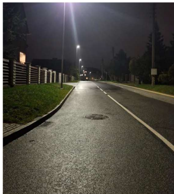
Rasos g. po rekonstrukcijos