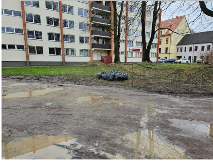
Pėsčiųjų praėjimo takas tapo purvyne