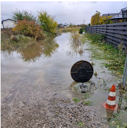
Apsemtas žvyruotas kelias link Urbikių g.