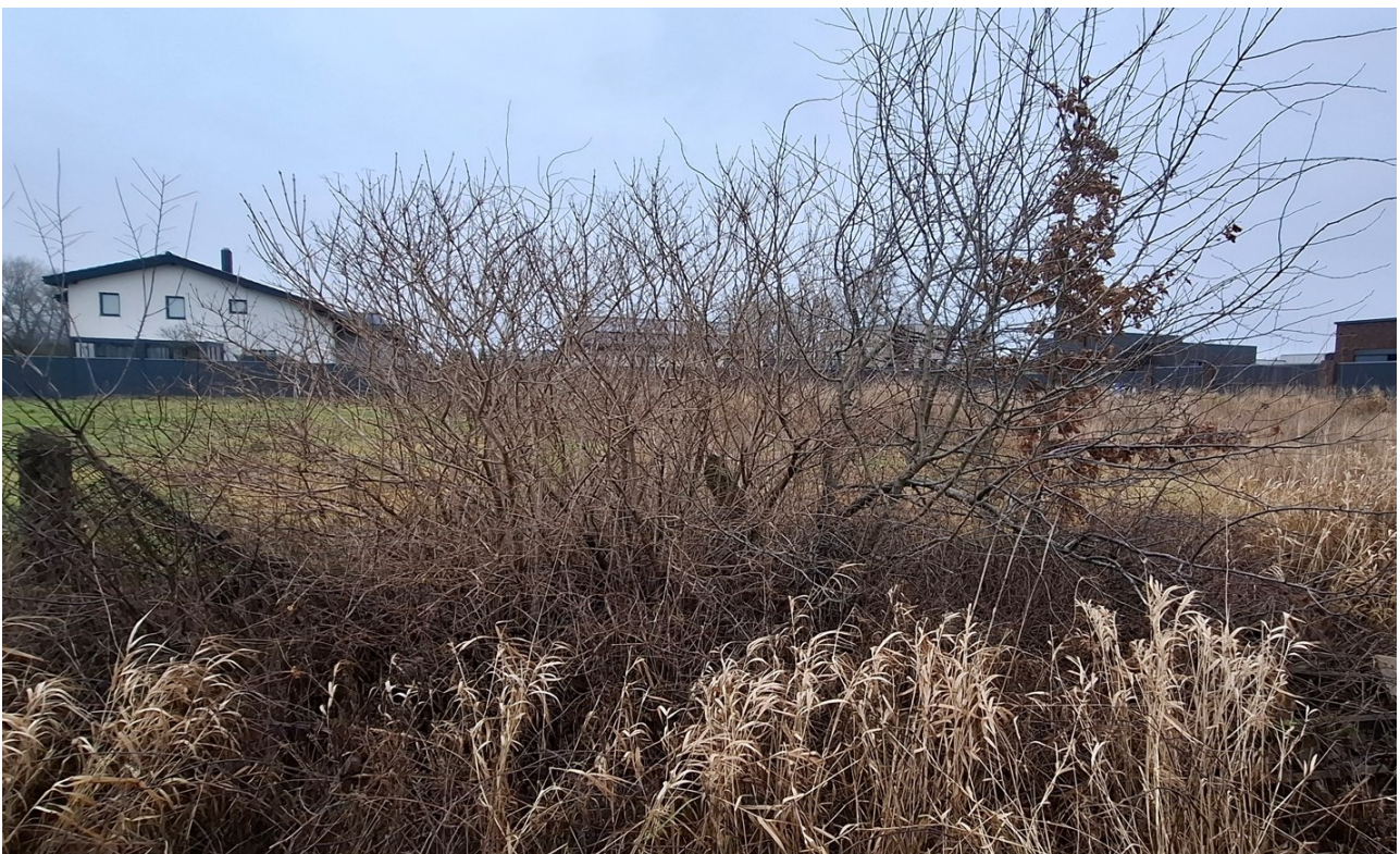
Duomenų šaltinis sklypo nuotrauka 2025 m. gruodis.

Miestuose augantys medžiai ir krūmai pagal nustatytus kriterijus yra saugotini, jų kirtimas griežtai reglamentuojamas. Kriterijų, pagal kuriuos medžiai ir krūmai, augantys ne miškų ūkio paskirties žemėje, priskiriami saugotiniams, sąrašas, patvirtintas Lietuvos Respublikos Vyriausybės 2008 m. kovo 12 d. nutarimu Nr. 206 „Dėl kriterijų, pagal kuriuos medžiai ir krūmai, augantys ne miškų ūkio paskirties žemėje, priskiriami saugotiniams, sąrašo patvirtinimo ir medžių ir krūmų priskyrimo saugotiniams“. Pagal nutarime nurodytus kriterijus, planuojamoje teritorijoje esantys savaime užaugę krūmai nepriskiriami saugotiniams.