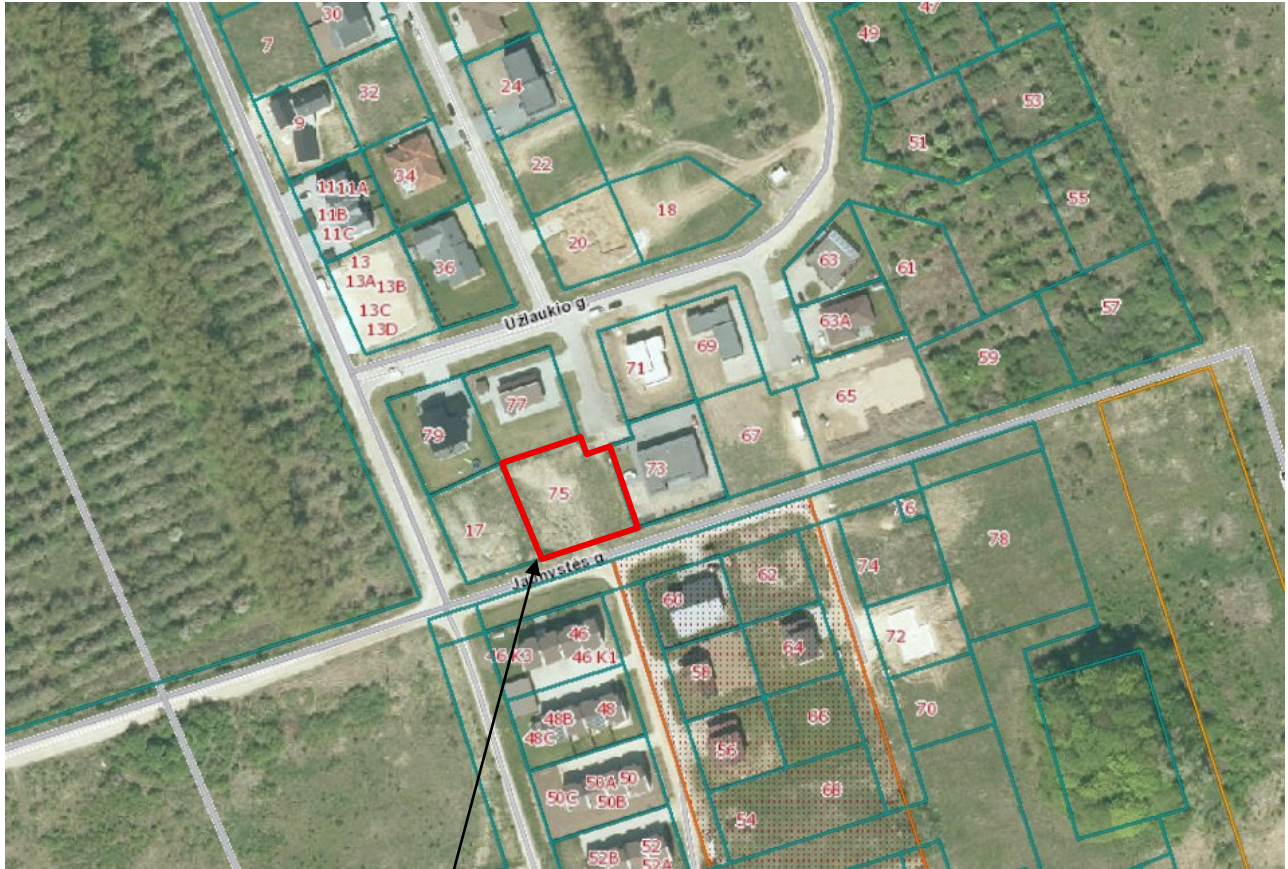
Planuojamas žemės sklypas Užlaukio g. 75, Klaipėdoje.

1.1. Detaliojo plano iniciatorius. Fiziniai asmenys (duomenys nuasmeninti).