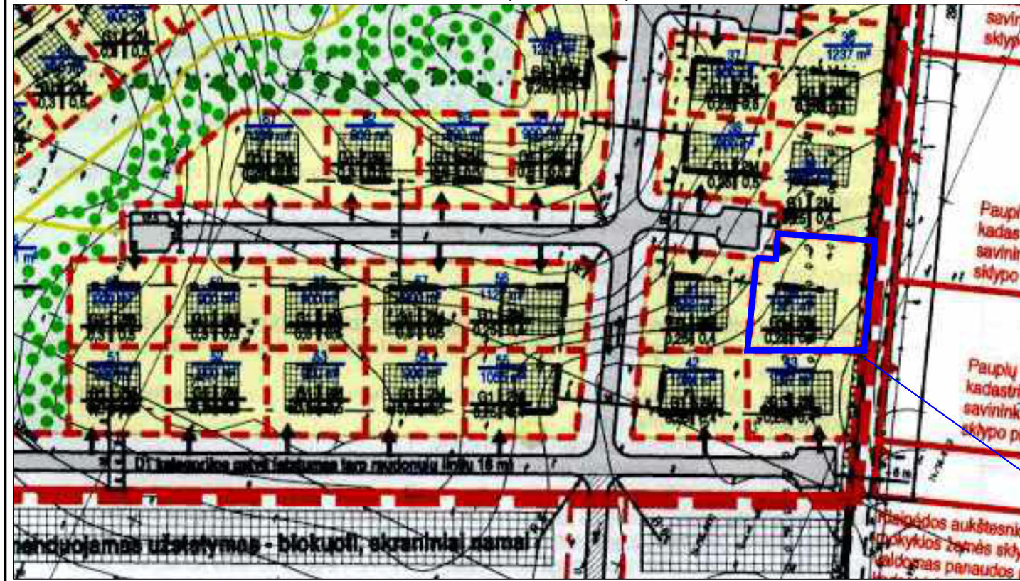
Planuojamas žemės sklypas Uzlaukio g. 75, Klaipėdos m. detalijame plane pažymėtas Nr. 40.