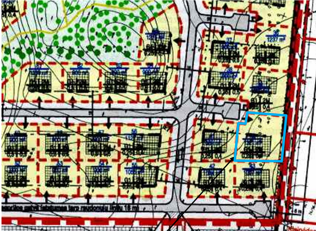
Planuojamas žemės sklypas detalajame plane pažymėtas Nr. 40