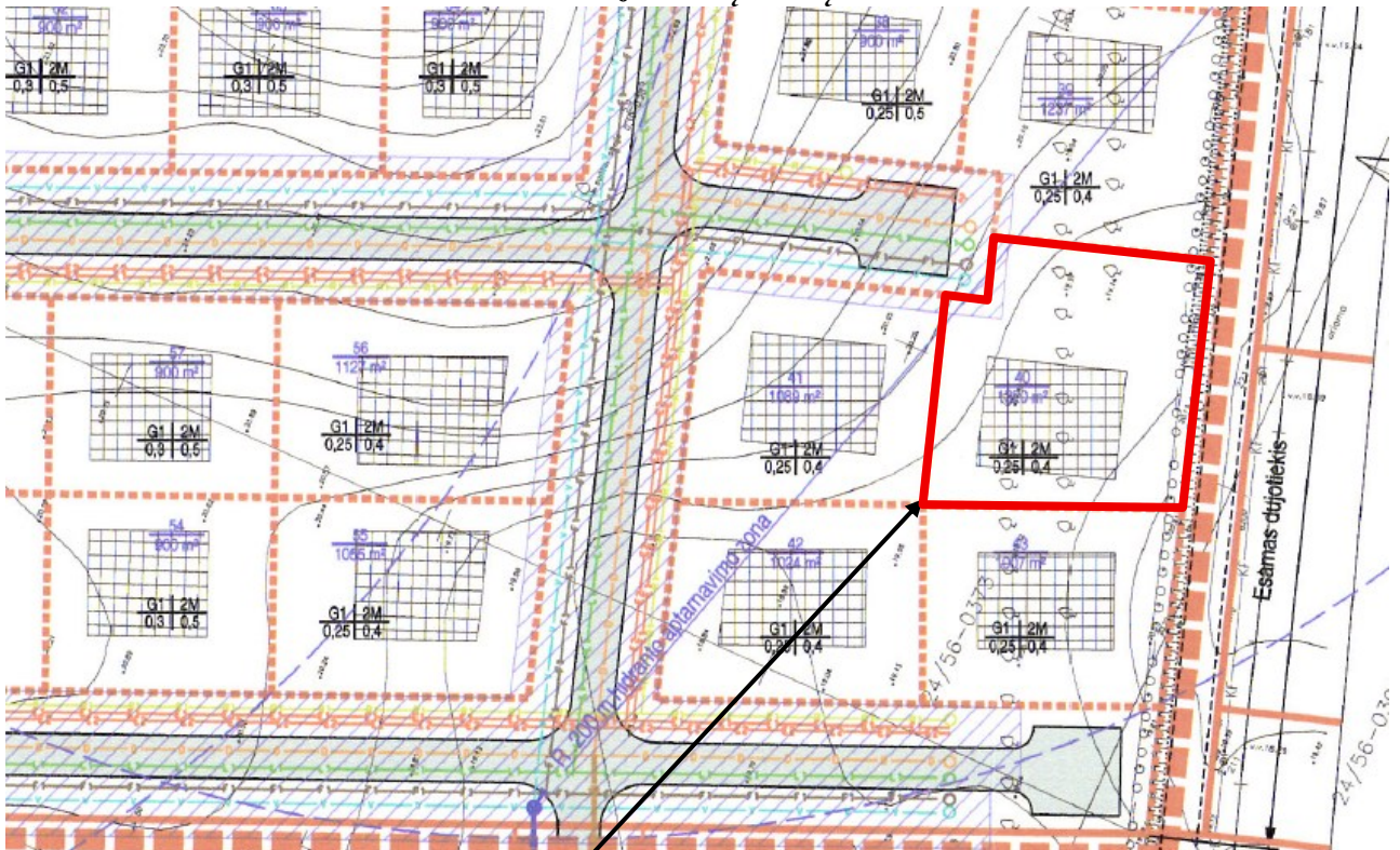
Planuojamas žemės sklypas detalajame plane pažymėtas Nr. 40