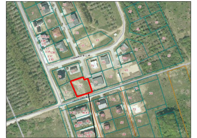
Planuojamas žemės sklypas