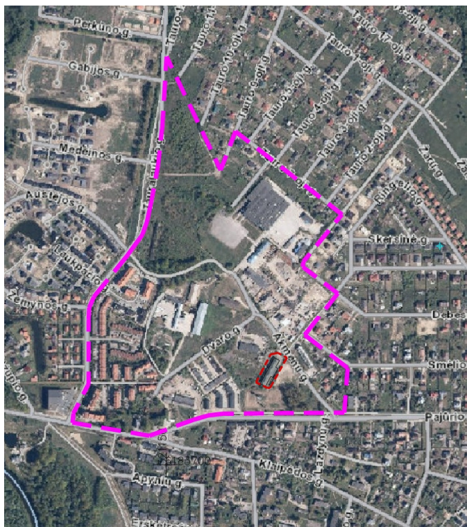
SITUACIJOS SCHEMA SU NAGRINĖJAMA TERITORIJA

sandėliavimo objektų teritorijos sklypu Dvaro g. 6 (sklype yra negyvenamasis sandėliavimo paskirties pastatas), gyvenamosios teritorijos daugiaaukščių ir aukštybinių gyvenamųjų namų statybos sklypu Akmenų g. 1B (sklype pastatų nėra), komercinės paskirties objektų teritorijos sklypu Pajūrio g. 5A (5,5A,5B) (sklype yra negyvenamieji sandėliavimo ir prekybos paskirties pastatai) bei valstybine žeme, kurioje sklypai nesuformuoti (valstybinėje žemėje yra negyvenamieji sandėliavimo pastatai). Toliau už žemės sklypo Pajūrio g. 5A, Pajūrio g. 3 sklype yra blokuoti vienbučiai dvibučiai gyvenamieji pastatai. Už šios sklypo Pajūrio g. 2 sklypas - statybinės įmonės teritorija ir pastatas.