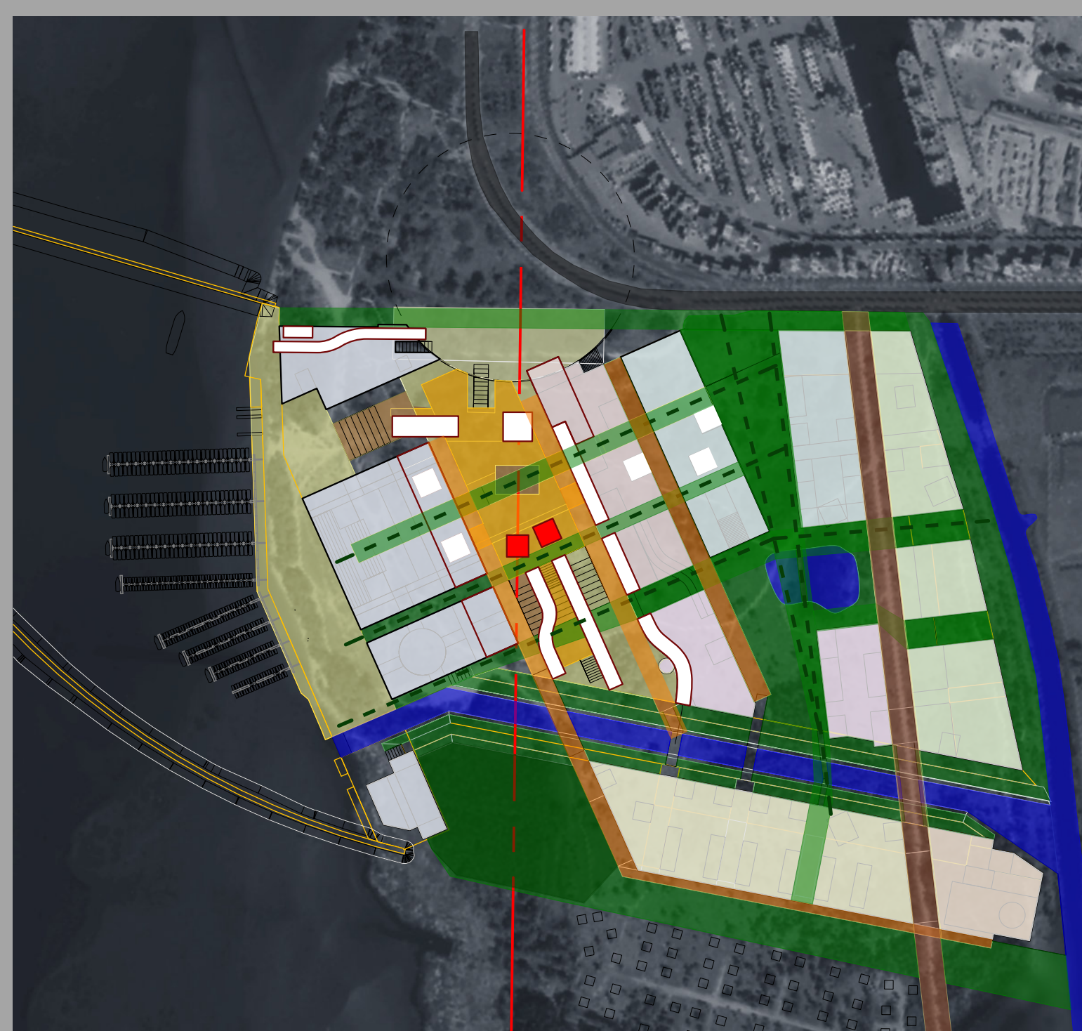
TERITORIJOS ERDVINĖS STRUKTŪROS SCHEMA