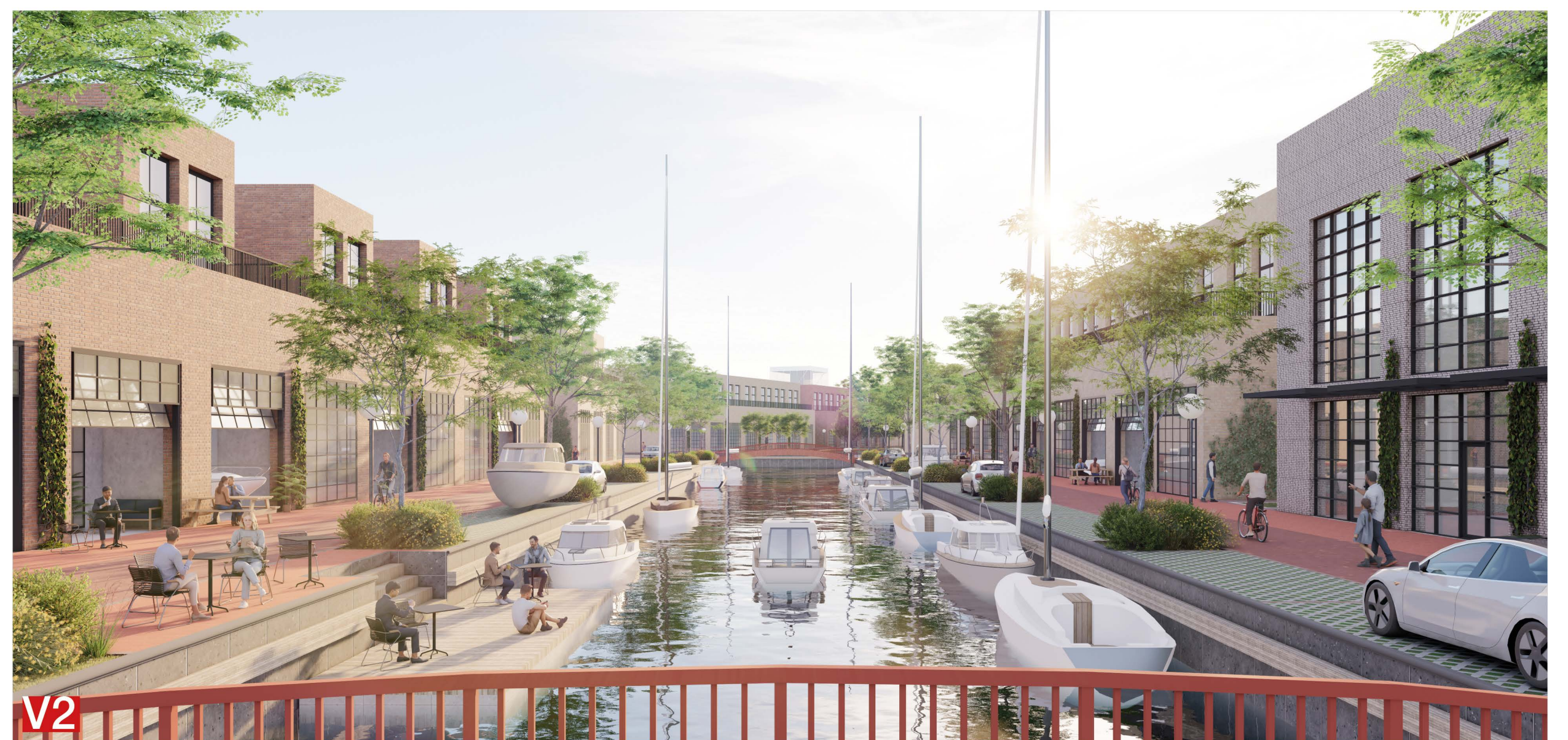
MARINOS ZONAS VIZUALIZACIJA IŠ PAGRINDINIĒS GATVĒS / ŽALIOS JUNGTIĒS