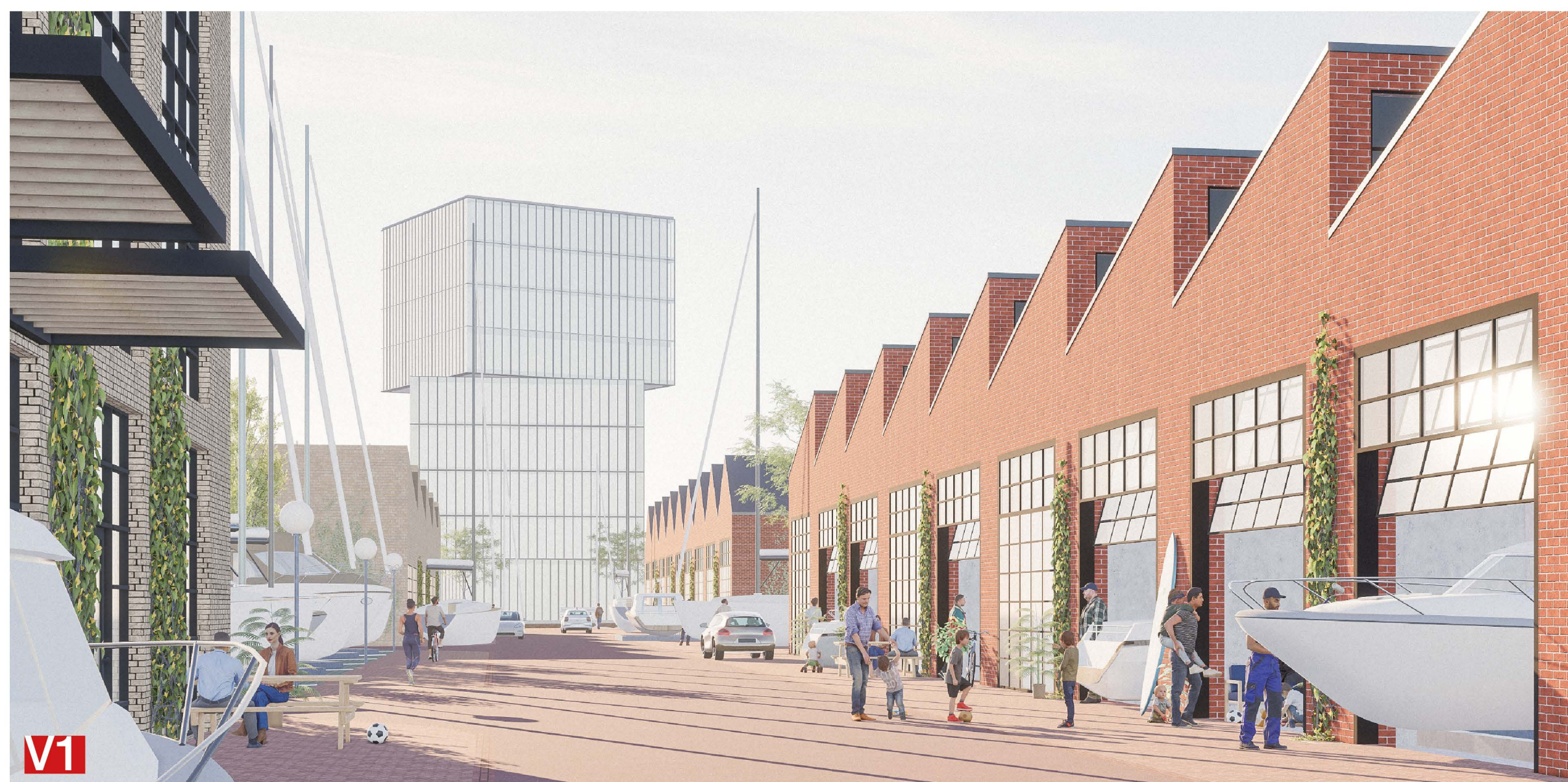
MARINOS ZONAS VIZUALIZACIJA IŠ VIDINIŲ GATVIŲ