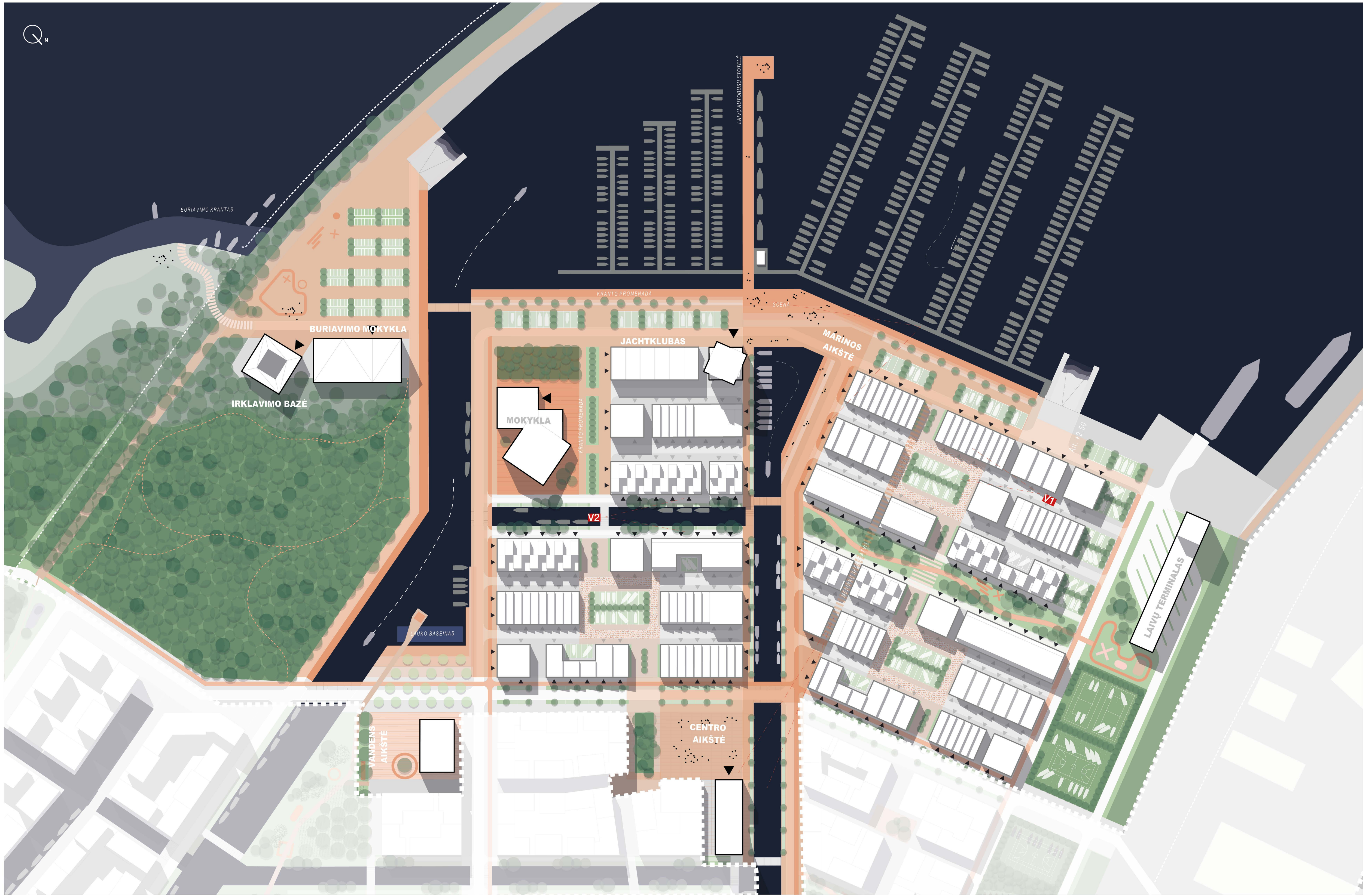
MARINOS ZONAS DETALIZACIJOS SKLYPO PLANAS M 1:1500