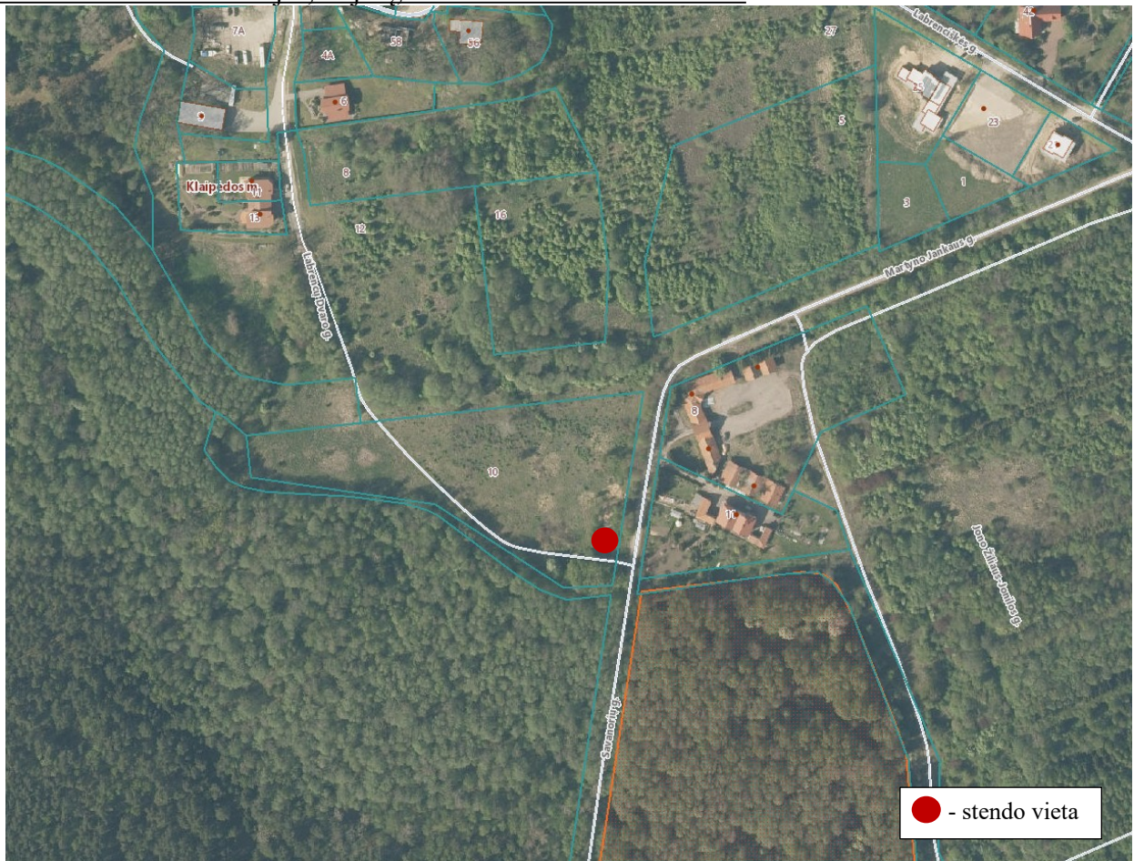
2 pav. Informacinio stendo vieta

18.2. detaliojo plano iniciatorius yra atsakingas už informacinio stendo įrengimą, priežiūrą viso detaliojo plano proceso metu. Taip pat turi užtikrinti informacinio stendo vizualinius, turinio ir konstrukcinius kokybės reikalavimus. Informacinis stendas turi būti pagamintas iš aplinkos poveikiui atsparių ir kokybiškų medžiagų. Informaciniame stende pateikiama informacija (tekstinė ir grafinė dalis) ne mažesniame kaip A2 formato lape (594 x 420 mm), kad tiltų visa Lietuvos Respublikos teritorijų planavimo įstatyme ir Visuomenės informavimo, konsultavimo ir dalyvavimo priimant sprendimus dėl teritorijų planavimo nuostatuose, patvirtintuose Lietuvos Respublikos Vyriausybės 1996 m. rugsėjo 18 d. nutarimu Nr. 1079, nurodyta skelbtina informacija. Informacija stende turi būti pateikta aiškiai, įskaitomai ir be gramatinių klaidų. Informacinis stendas turi būti įrengiamas 2 pav. „Informacinio stendo vieta“ nurodytoje zonoje, įvertinus konkrečios vietos inžinerinius tinklus, susisiekimo komunikacijas, reljefą, esamus želdinius ir statinius.