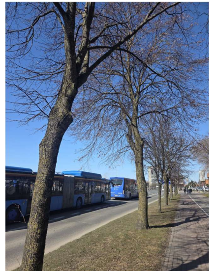
Pav. Želdyno fragmentai. Taikos pr., Klaipėda. 2026.03.25-27.