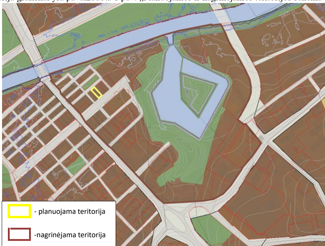
1 pav. Planuojamos ir nagrinėjamos teritorijos schema

3. Nagrinėjama (numatomų sprendinių įtaką patirianti) teritorija: vadovaujantis Klaipėdos miesto bendroju planu, patvirtintu Klaipėdos miesto savivaldybės tarybos 2021 m. rugsėjo 30 d. sprendimu Nr. T2-191 „Dėl Klaipėdos miesto bendrojo plano keitimo patvirtinimo“, apima 6.4 Bastioninių įtvirtinimų ribas. Bendrojo plano sprendiniai yra paspaudus šią nuorodą: https://www.klaipeda.lt/lt/savivaldybe/administracija/miesto-bendrasis-planas/218 . Nagrinėjama teritorija grafiškai yra pavaizduota 1 pav. „Planuojamos ir nagrinėjamos teritorijos schema“.