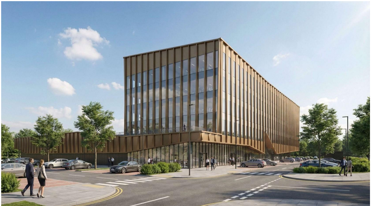
Vaizdas iš pietvakarių pusės