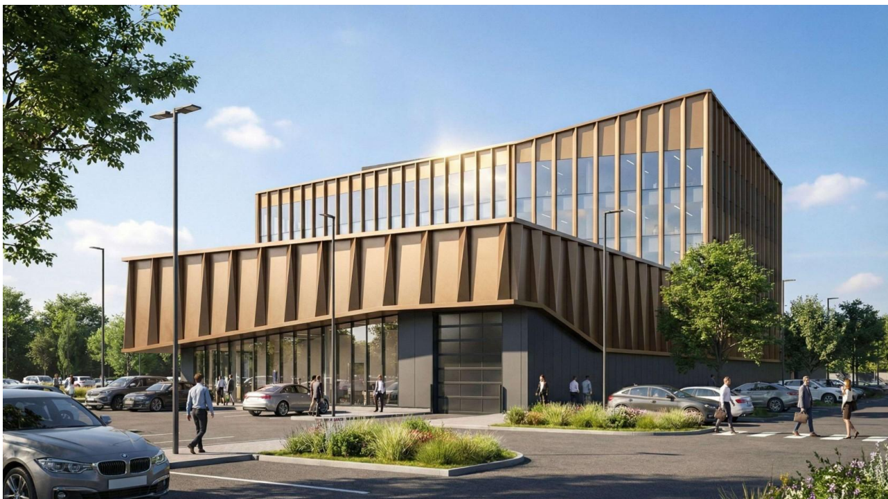
Vaizdas iš šiaurės vakarų pusės