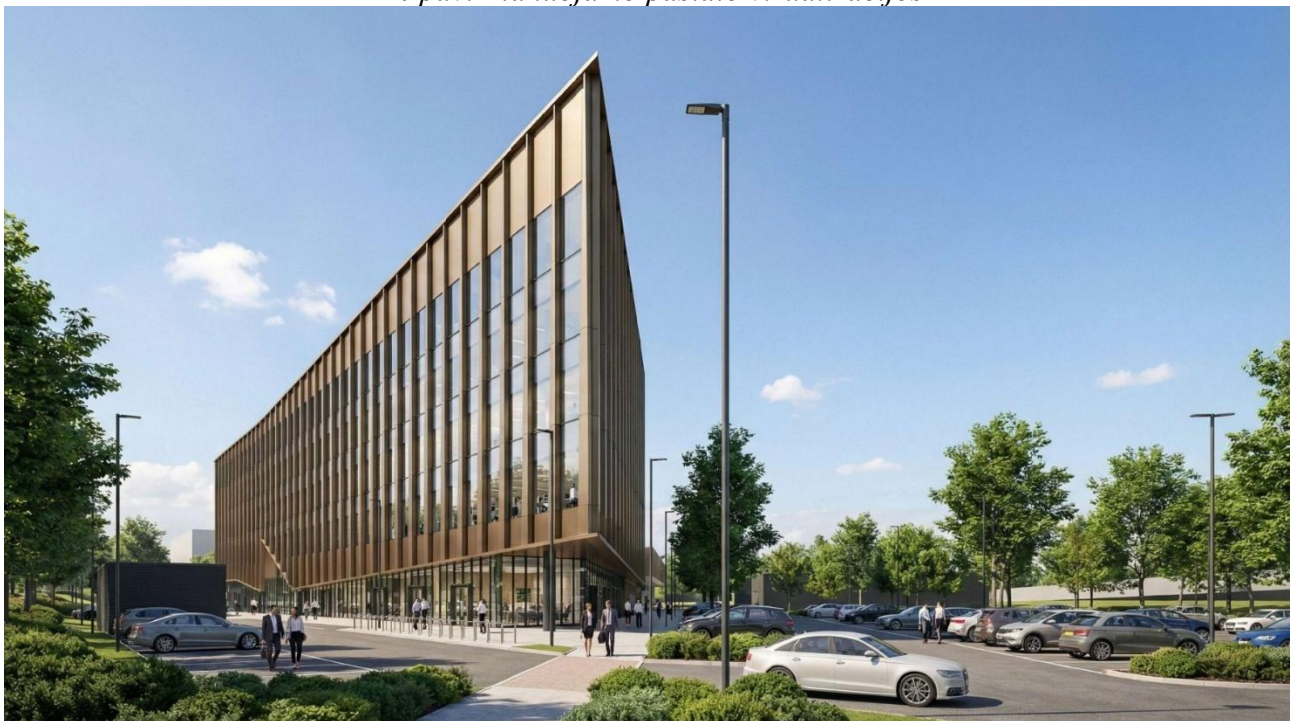
1-4 pav. Planuojamo pastato vizualizacijos