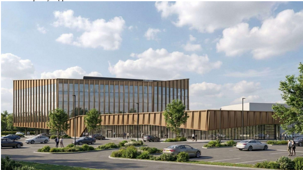
Vaizdas iš šiaurės rytų pusės