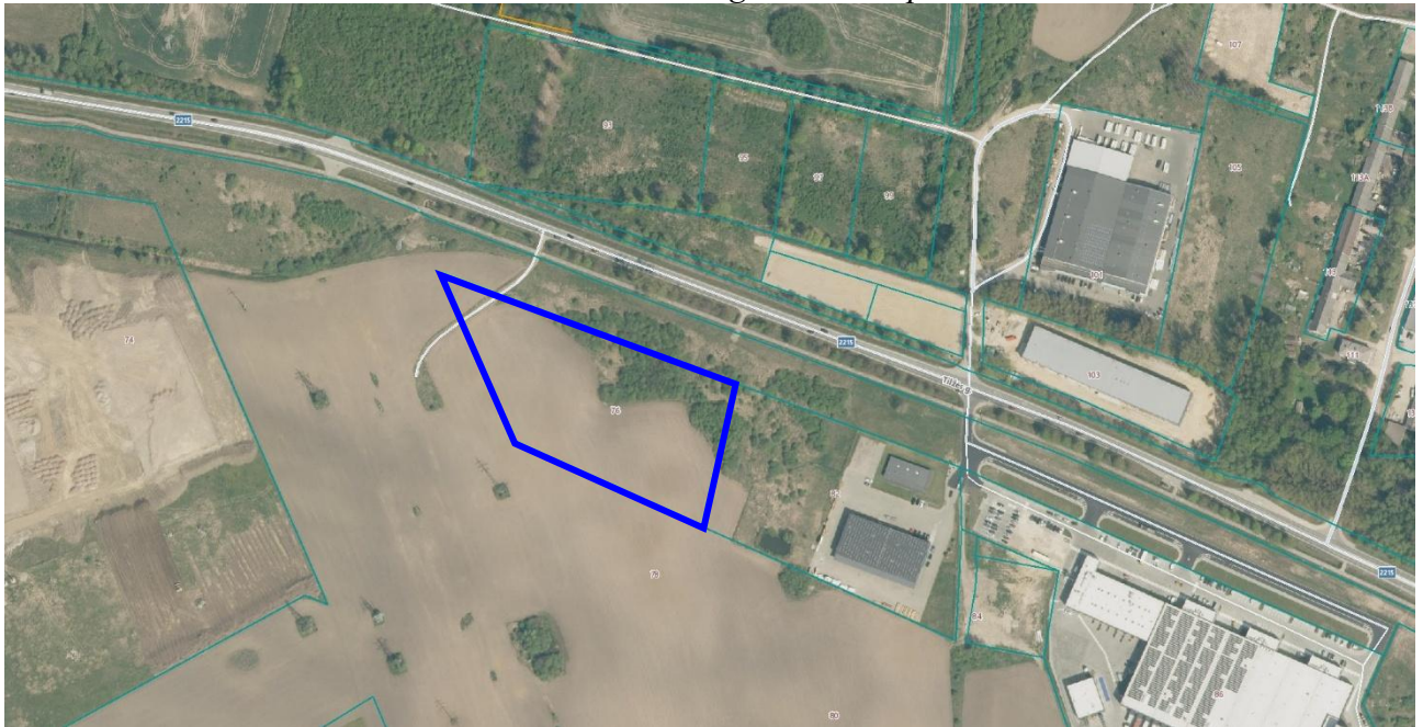
— Koreguojamas sklypas