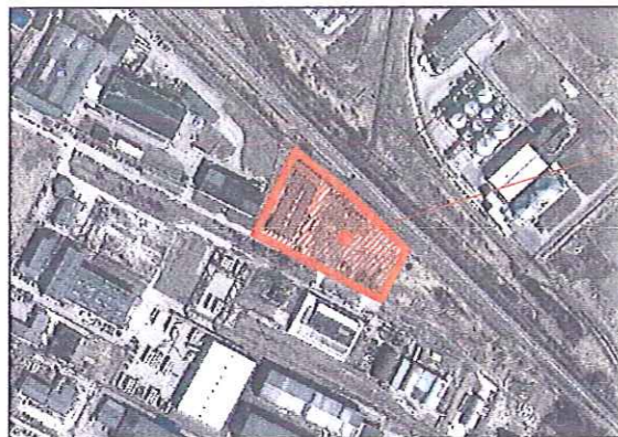
PLANUOJAMAS ŽEMĖS SKLYPAS ŠILUTĖS PL. 95B, KLAIPĖDA