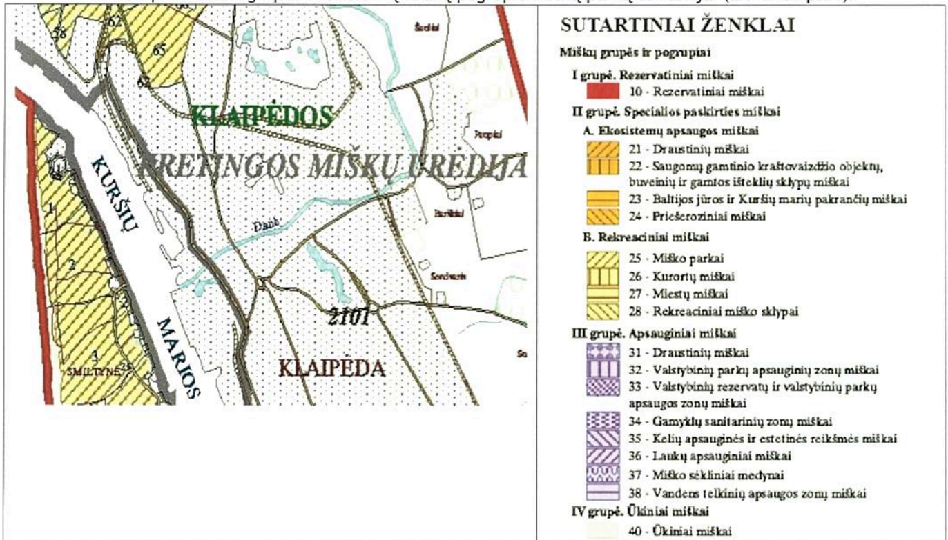
4.4.1 pav. Ištrauka iš Klaipėdos miesto savivaldybės valstybinės reikšmės miškų plotų schemos.

Miškas priklauso II grupės rekreacinių miškų pogrupio miškų parkų teritorijai (žr. 4.4.1 pav.).