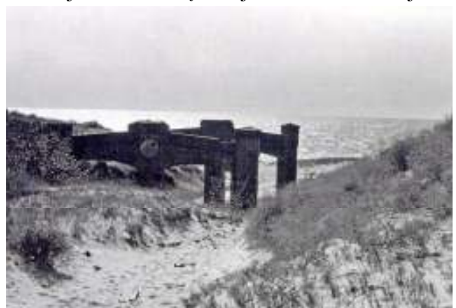
1971 m.

Tikslinga atstatyti mūrinį laivų gelbėjimo stoties pastatą.