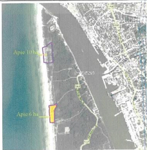
Planuojamos teritorijos situacijos schema