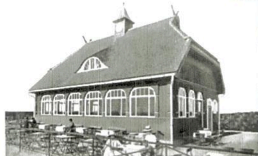
Kavinė- restoranas Strandhalle 1910-1920 m.